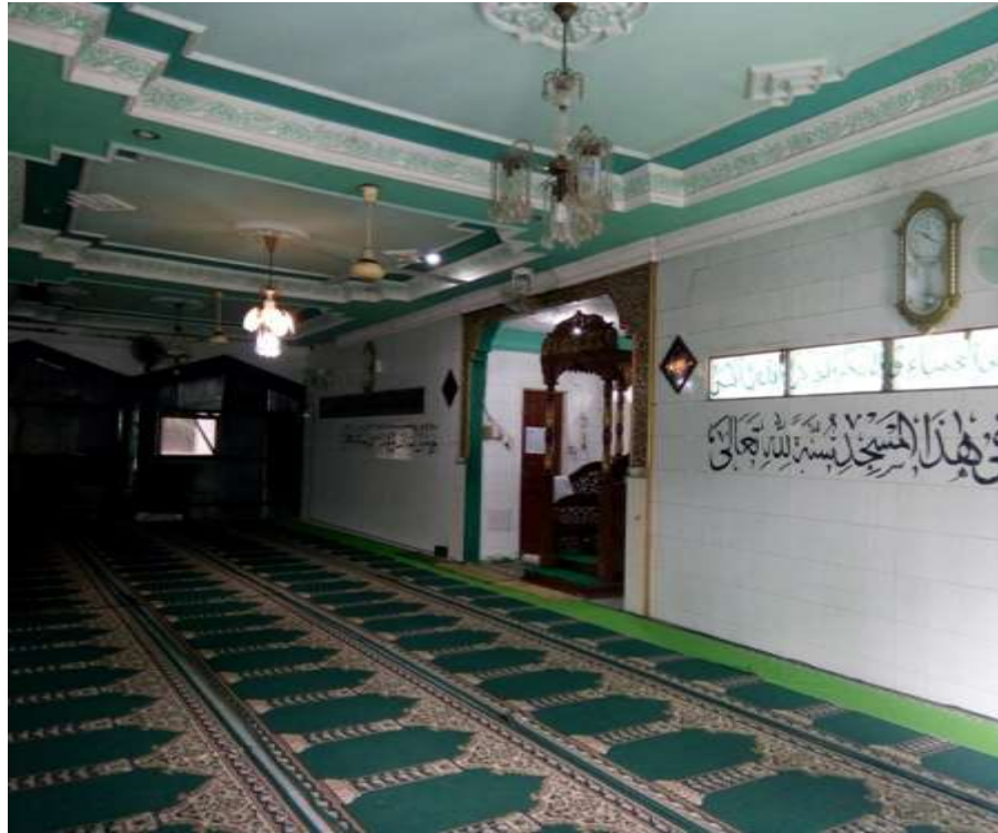
2. Masjid Al-Kharamah dalam proses renovasi.