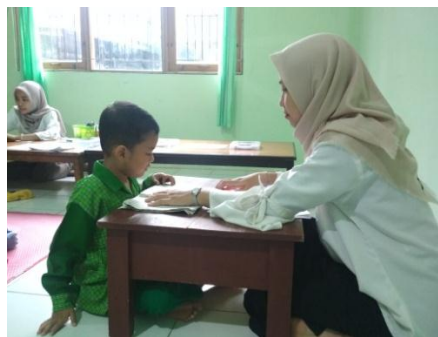
Gambar VI (cdf.2) 13

Pijakan lingkungan main seperti hari sebelumnya Ibu FW dan Ibu NH menyiapkan media yang akan digunakan dan menata lingkungan bermain anak. Ibu FW menyiapkan wadah meronce manik-manik dan tali yang akan digunakan diatas alas. Setelah lingkungan main disiapkan Ibu FW siap untuk mengajak anak jurnal pagi terlebih dulu baru setelah itu anak diperbolehkan menggunakan mainan diatas alas.