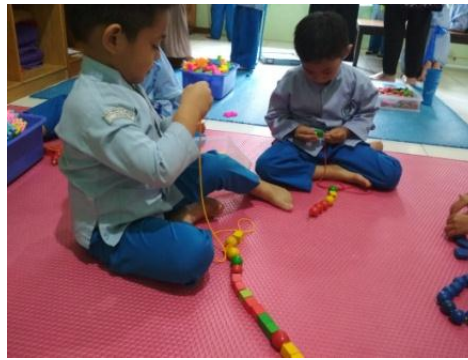
Gambar V (cdf.9) 12

Pijakan saat anak bermain meronce Ibu FW dan Ibu NH selalu mengamati dan mendampingi kegiatan anak. Ibu FW menanyakan tentang warna apa saja yang ada dalam wadah meronce, dan bentuk apa saja yang sudah anak pegang, Ibu FW juga mengajak anak berhitung saat media meronce dimasukkan anak kedalam tali. setelah semua anak sudah menghasilkan karya dari meronce, Ibu FW dan Ibu NH mengajak anak untuk beres-beres.