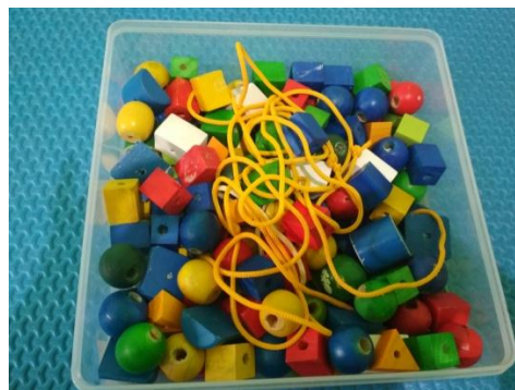
Gambar III (cdf.3)

Guru melakukan pijakan lingkungan menyiapkan berbagai media yang diperlukan dalam kegiatan pembelajaran meronce. sebelum memulai kegiatan Ibu FW menjelaskan cari mainnya terlebih dahulu.