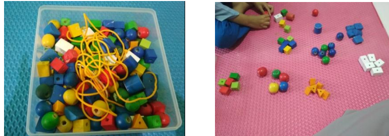
Gambar VIII (cdf.3.4)

sebenarnya dapat merangsang kemampuan anak dalam menstimulus perkembangan anak (clwgc3).