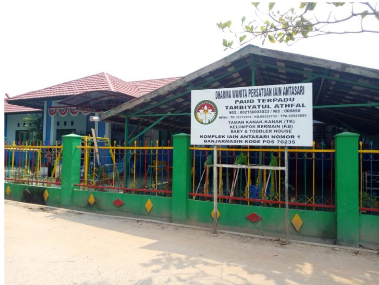
Gambar I, (cdf.1) 3

Terpadu Tarbiyatul Athfal Banjarmasin beralamat di JL. A. Yani Km 4,5 Komplek UIN Antasari RT. 21 RW. 02 Kelurahan Kebun Bunga Kecamatan Banjarmasin Timur Kota Banjarmasin (cdfu2) 2 .