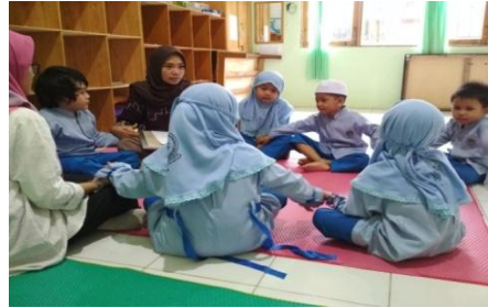
Gambar II (cdf.15) 9