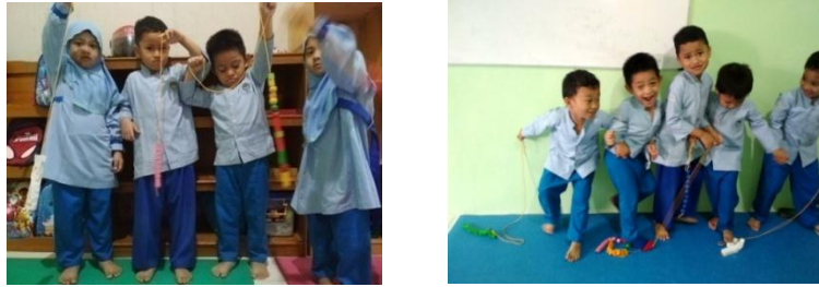
Gambar VII (cdf.10)