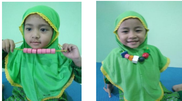
Gambar IV (cdf.15.16) 11