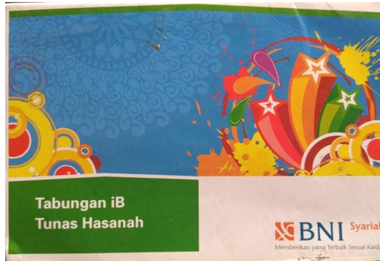
Sumber : Buku Tabungan iB Tunas Hasanah