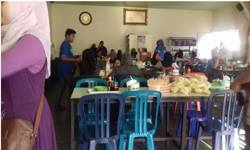
Suasana Di Warung Soto Ayam Suroboyo Cak Hari Banjarmasin