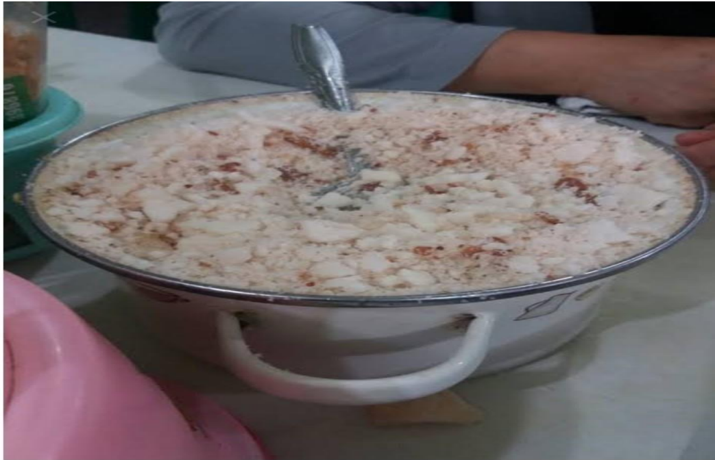
Menu pelengkap soto ayam suroboyo cak hari(koya)