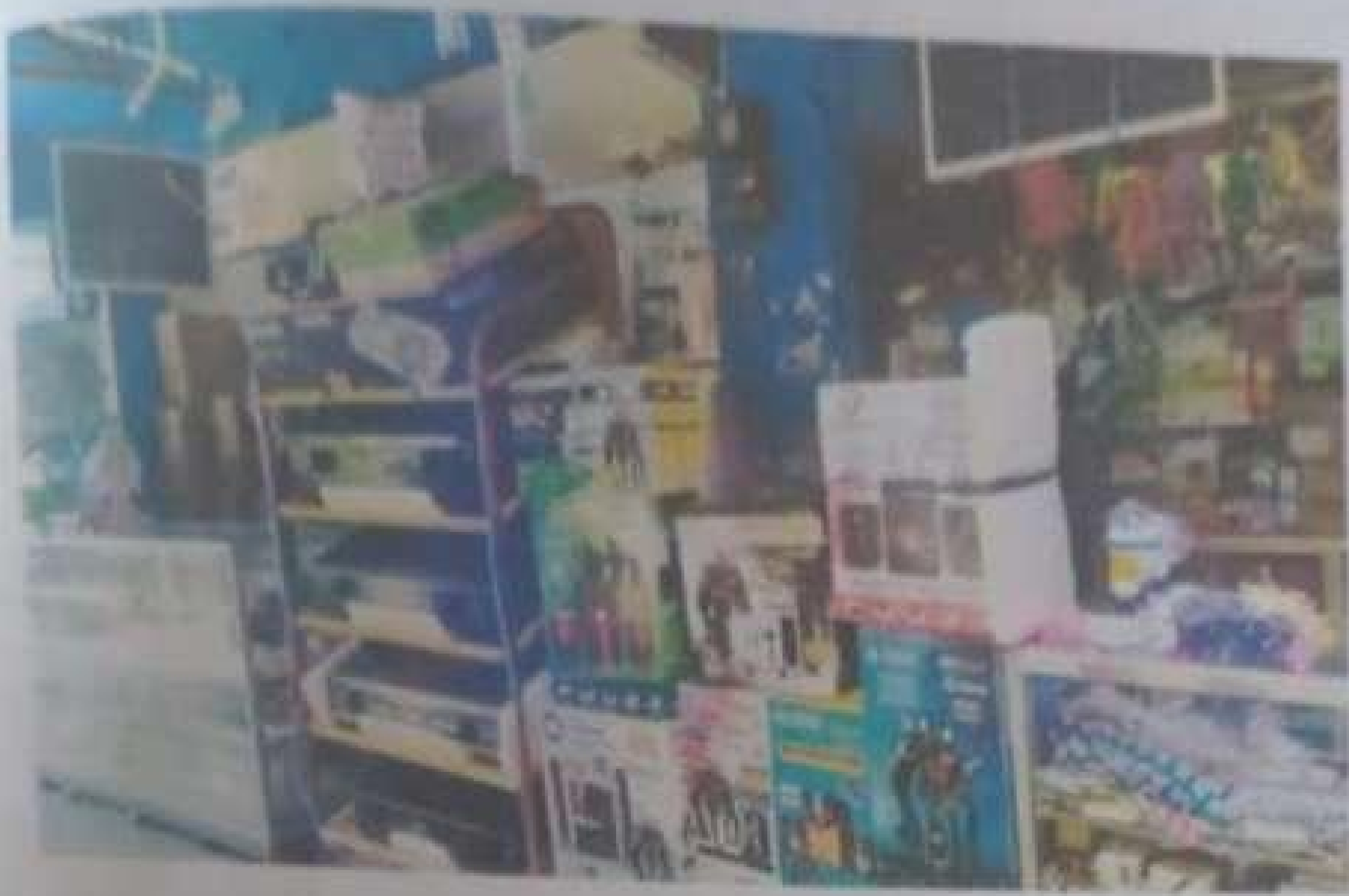
Alat-alat Elektronik yang dijual