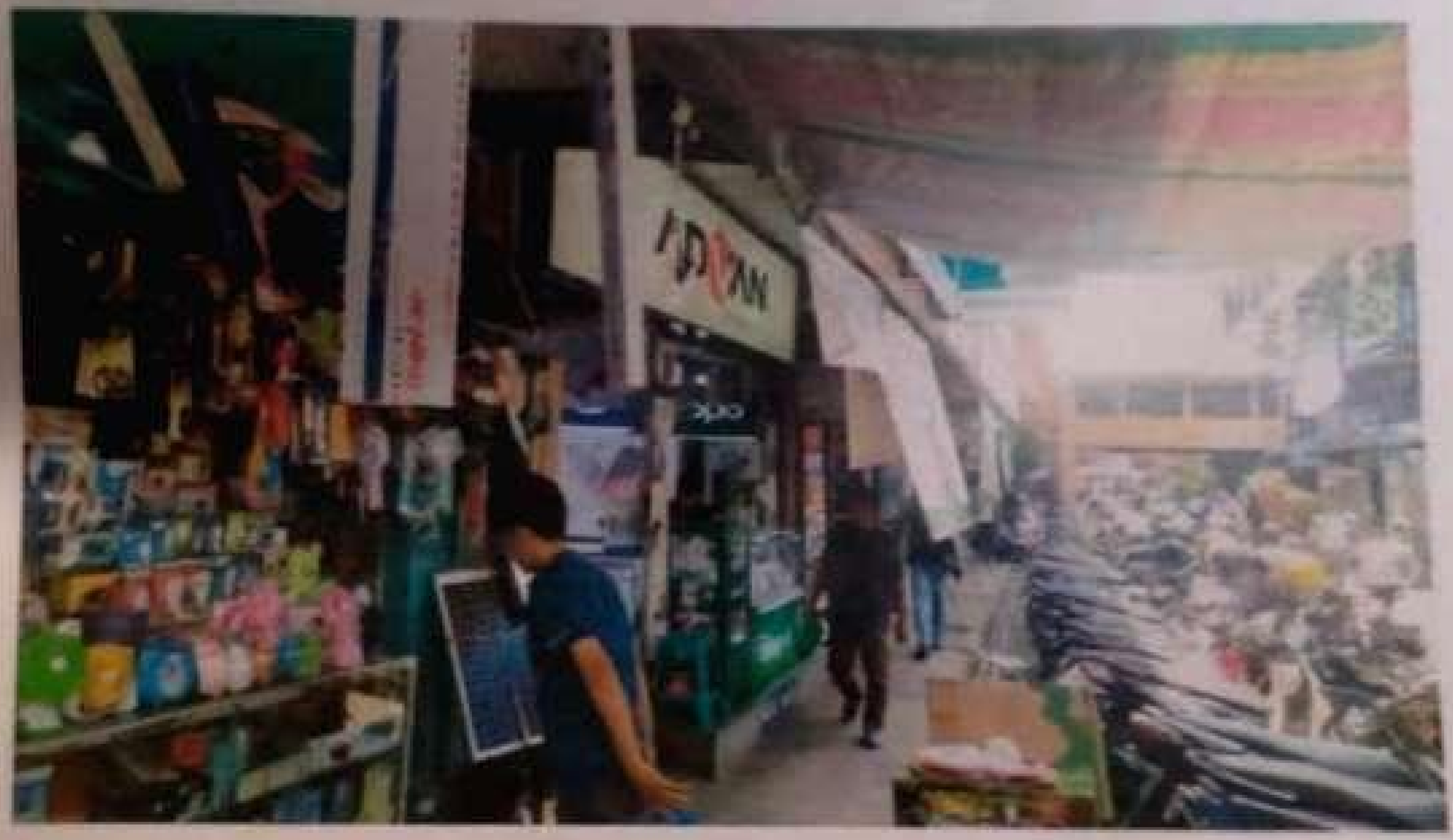
Potret Pasar Niaga Banjarmasin