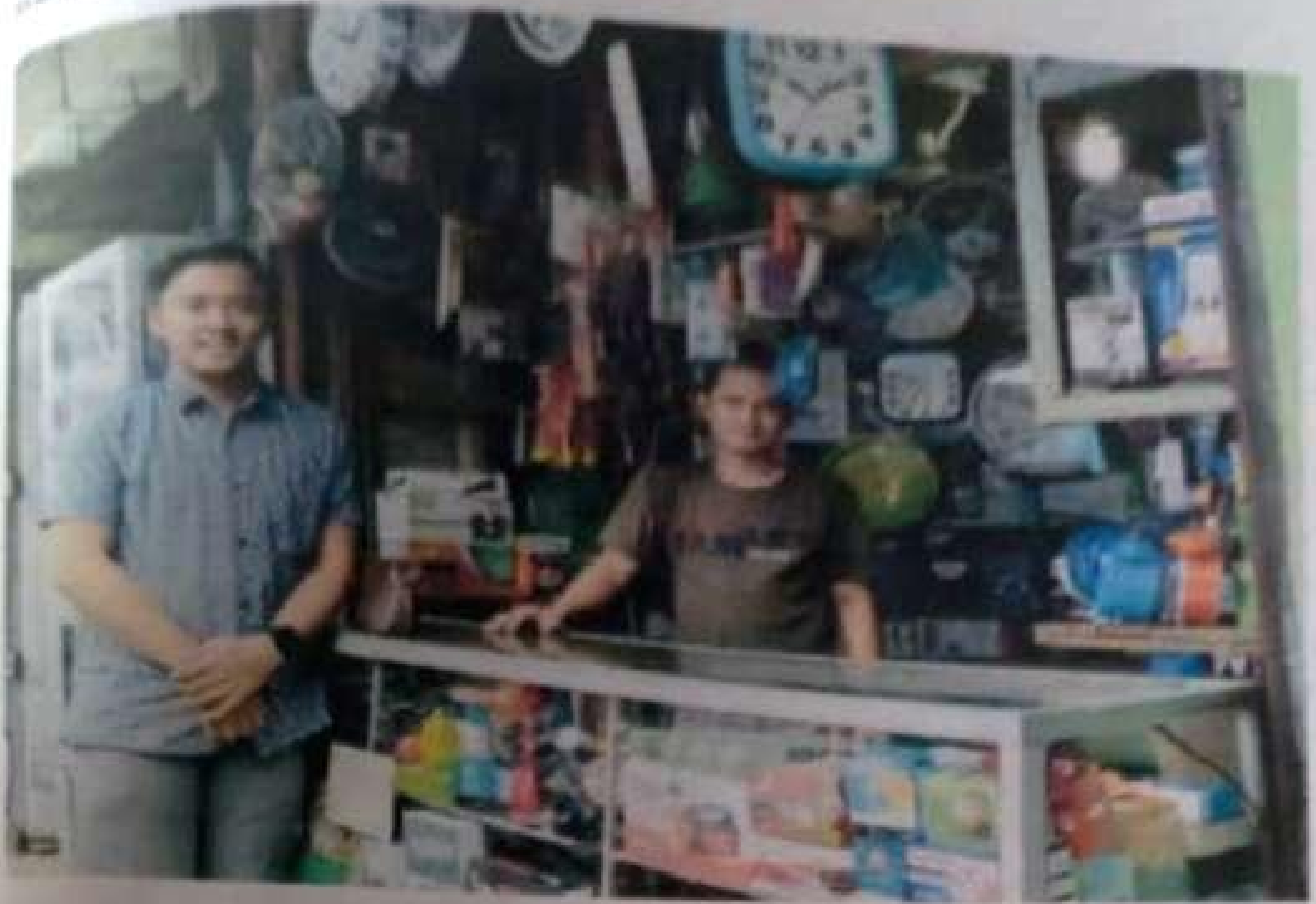
Dokumentasi Pedagang Elektronik 1