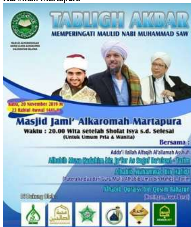
GAMBAR 4.6 Baliho Tablik Akbar di Masjid Agung Al-Karomah Martapura

Hambatan yang dihadapi pengurus biasanya adalah cuaca yang tidak bisa ditebak misalnya hujan deras dan jumlah jemaah yang membludak akhirnya tidak bisa terkontrol. Kadang-kadang perkiraan panitia tidak sesuai dengan jemaah yang hadir dan ada beberapa jemaah yang tidak kebagian konsumsi. 16