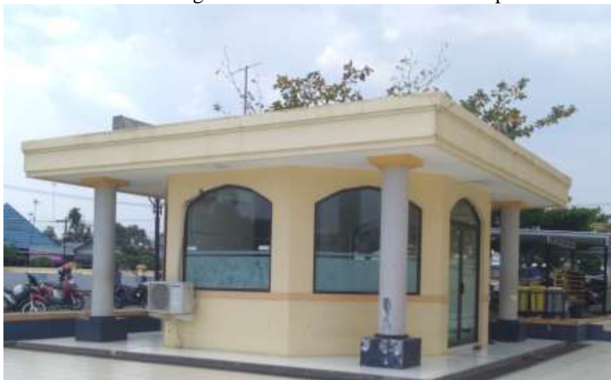
GAMBAR 4.5 Ruang siaran Radio Al-Karomah Martapura

Karomah, sehingga membuat banyak pendengar beralih ke media lain. 12