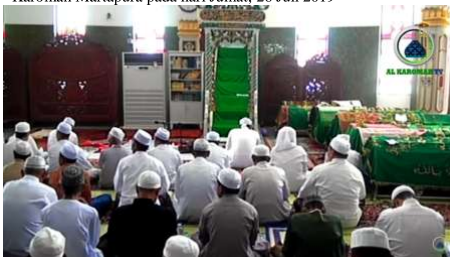
GAMBAR 4.4 Persiapan pelaksanaan salat jenazah di Masjid Agung Al-Karomah Martapura pada hari Jumat, 26 Juli 2019