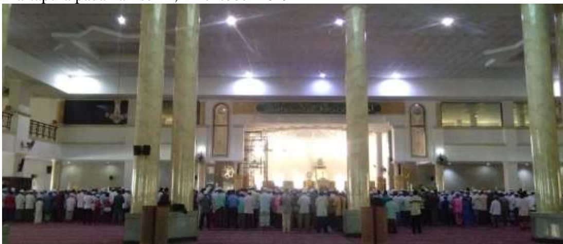
GAMBAR 4.2 Pelaksanaan salat zuhur berjemaah di Masjid Agung Al-Karomah Martapura pada hari senin, 14 oktober 2019

Ismail sedangkan untuk muazin cadangan H. Asmuni Hak, Zainal Abidin dan Ridho. 2