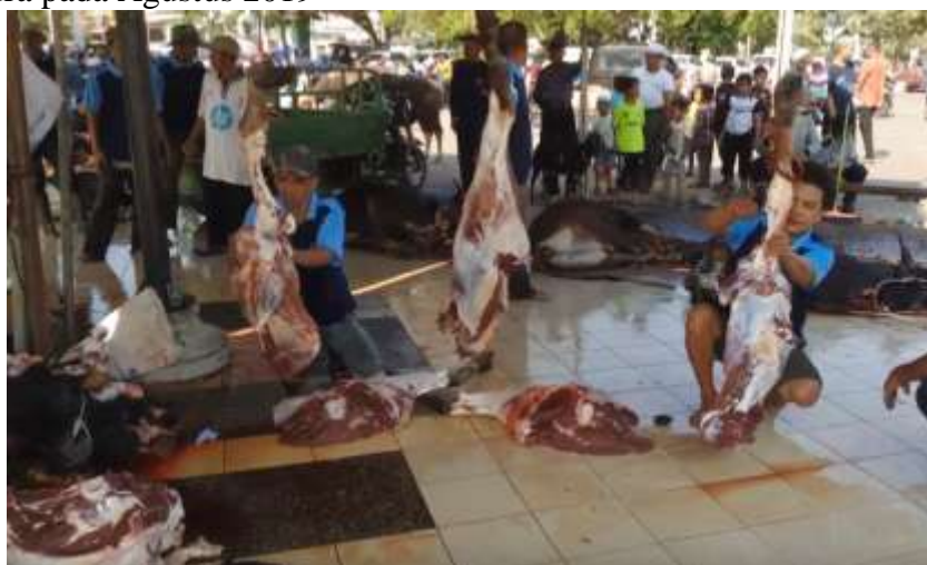
GAMBAR 4.9 Pemotongan hewan kurban di Masjid Agung Al-Karomah Martapura pada Agustus 2019