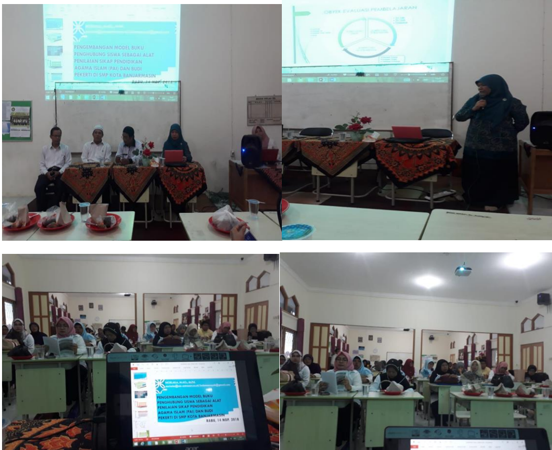
FOTO DESIMINASI HASIL PENELITIAN DISERTASI INSTRUMEN PENILAIAN SIKAP BENTUK BUKU PENGHUBUNG PADA FORUM MGMP GURU PAI DAN BUDI PEKERTI SMP KOTA BANJARMASIN