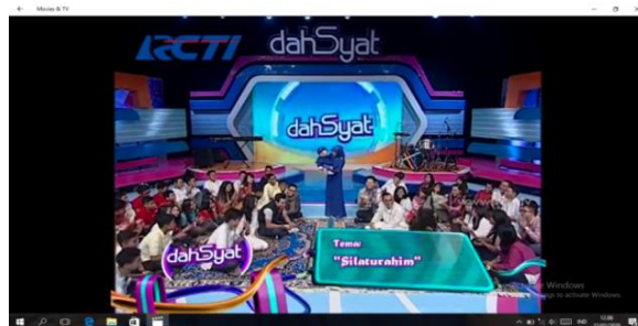
Gambar 4.2 Ceramah bertema silaturahmi

a. Video ceramah ustadzah Lulu Susanti dalam channel YouTube Daiah Lulu official yang bertema silaturahmi.