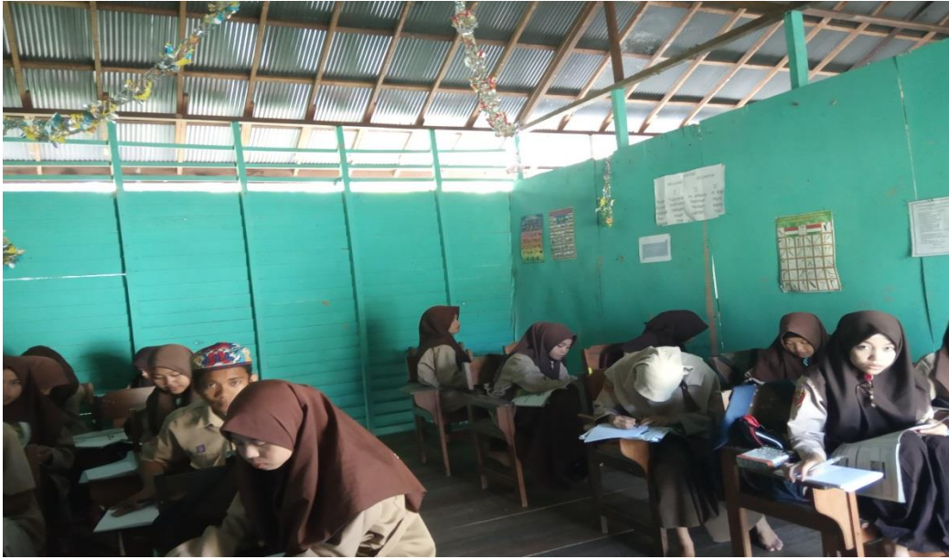
Appendix 5 :