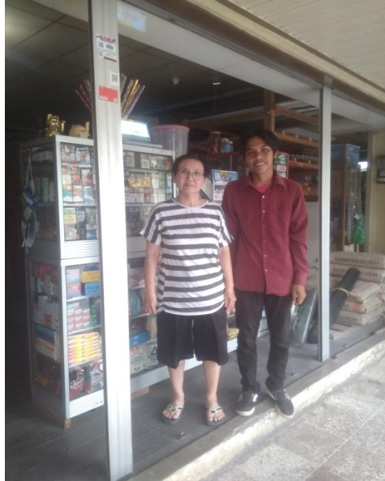
Foto bersama perwakilan informan kedua