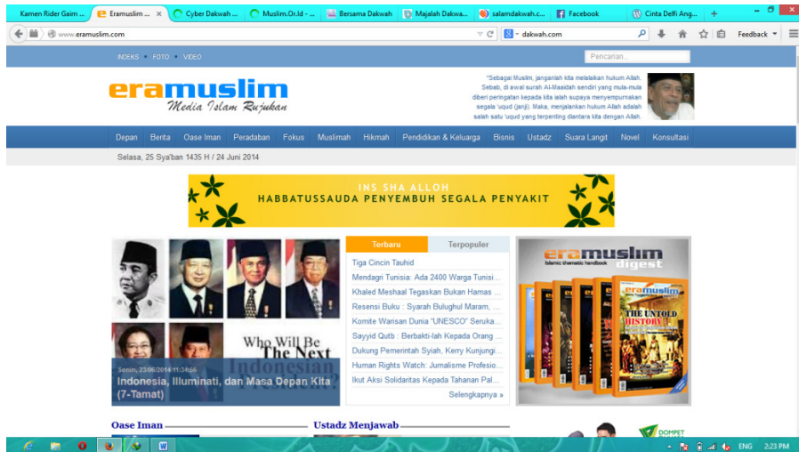
Gambar 1 Eramuslim.com