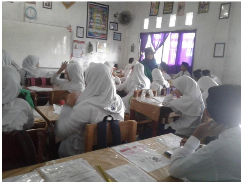
Gambar I Pemberian Angket dan Soal Tes di Kelas MTsN 4 Banjarmasin 2017/2018

Pelaksanaan pemberian angket dan soal tes dalam penelitian ini dilaksanakan pada hari Rabu tanggal 8 Nopember 2017. Dalam penelitian ini, peneliti memberikan angket dan soal tes di kelas IX A MTsN 4 Banjarmasin Tahun Pelajaran 2017/2018 dengan jumlah siswa 40 orang, namun 1 orang tidak berhadir pada saat itu. Jadi hanya 39 orang jumlah siswa yang menjadi sampel dalam penelitian ini.