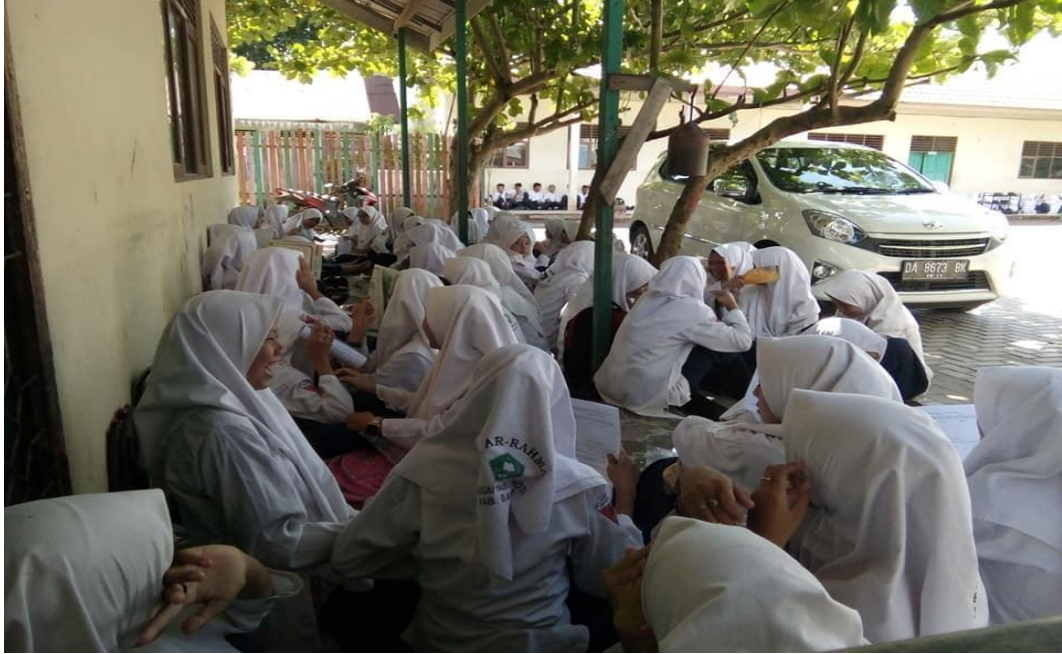
Foto bersama Kepala Sekolah Dan Wakil