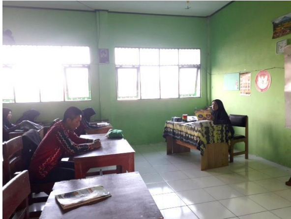
Gambar 1: Guru PAI ikut serta membaca Al-Qur'an sekaligus mengawasi peserta didik