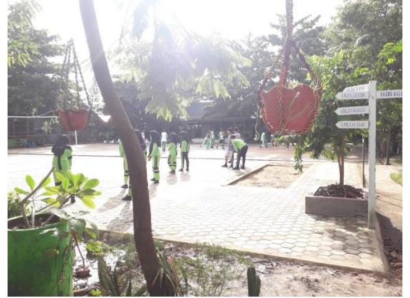
Gambar 4 & 5 : Lokasi Sekolah