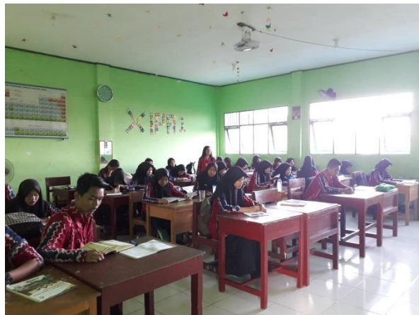
Gambar 2: Peserta didik membaca Alquran