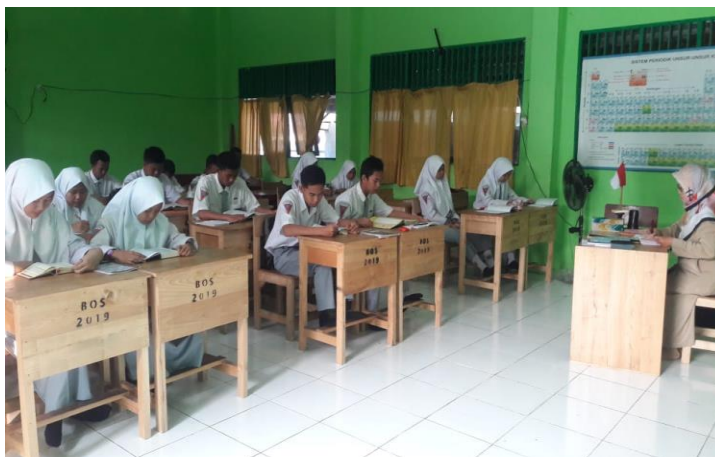
Gambar 7: selain guru PAI, guru lain yang mengajar di jam pertama pun turut mengawasi peserta didik