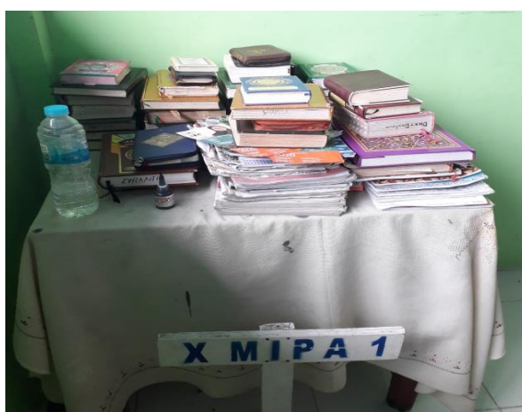
Gambar 3: Alquran yang disediakan di dalam kelas