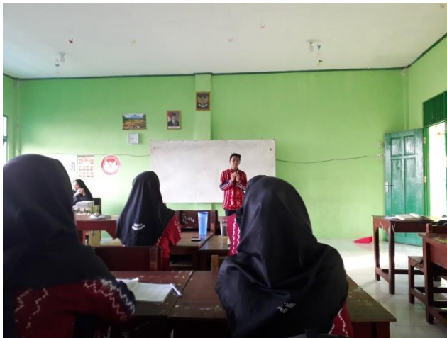
Gambar 6: Salah satu peserta didik memimpin doa sebelum memulai pelajaran dan kegiatan pembiasaan membaca Alquran