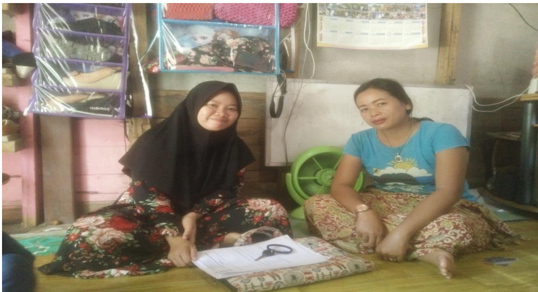
2. Bersama warga Desa Lemosedang melakukan wawancara pada saat penelitian