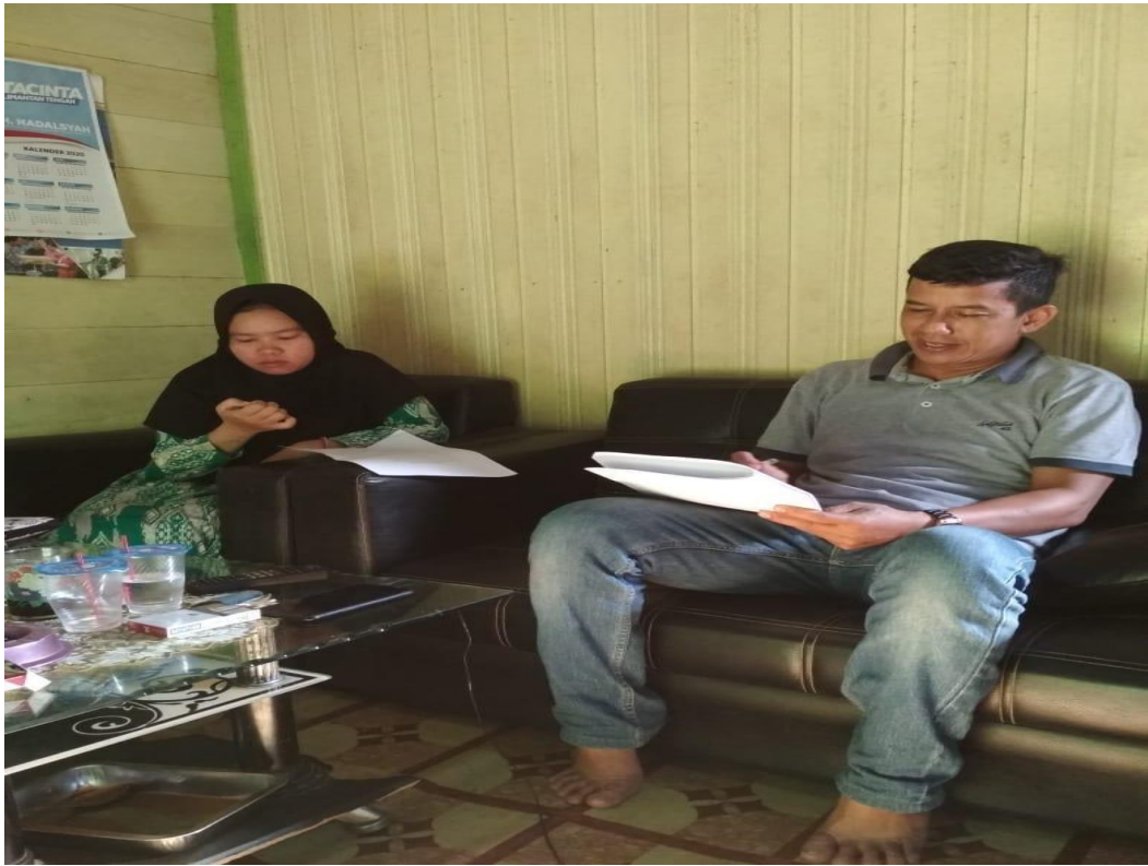
1. Bersama Pendeta di Desa Lemosaat melakukan wawancara dan penelitian