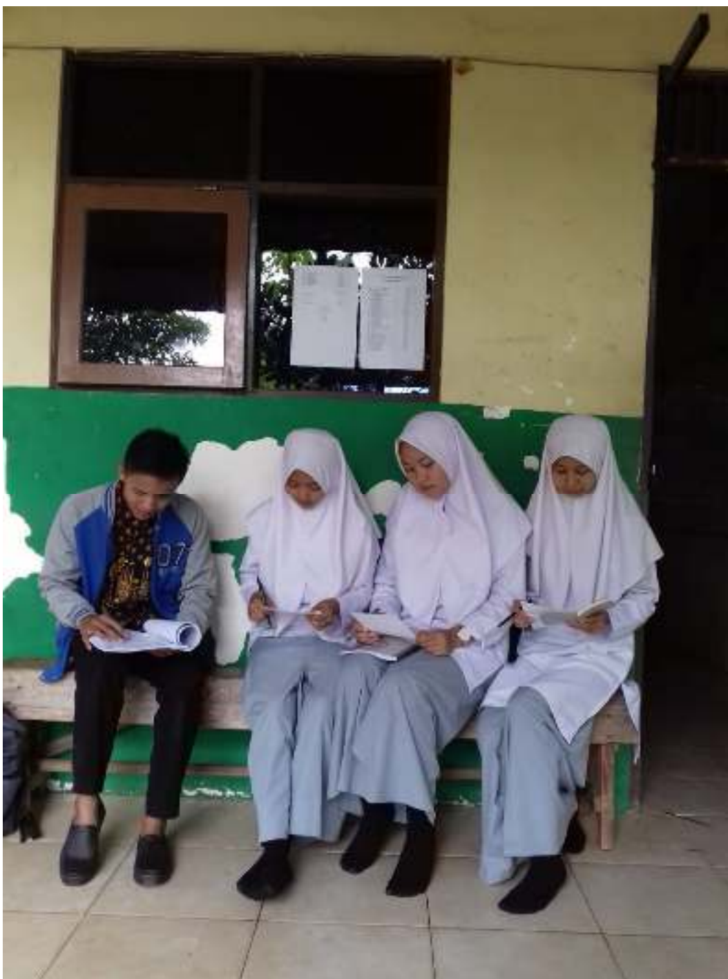
Saat mewawancarai kelas XI IPA di MAN 4 Banjar