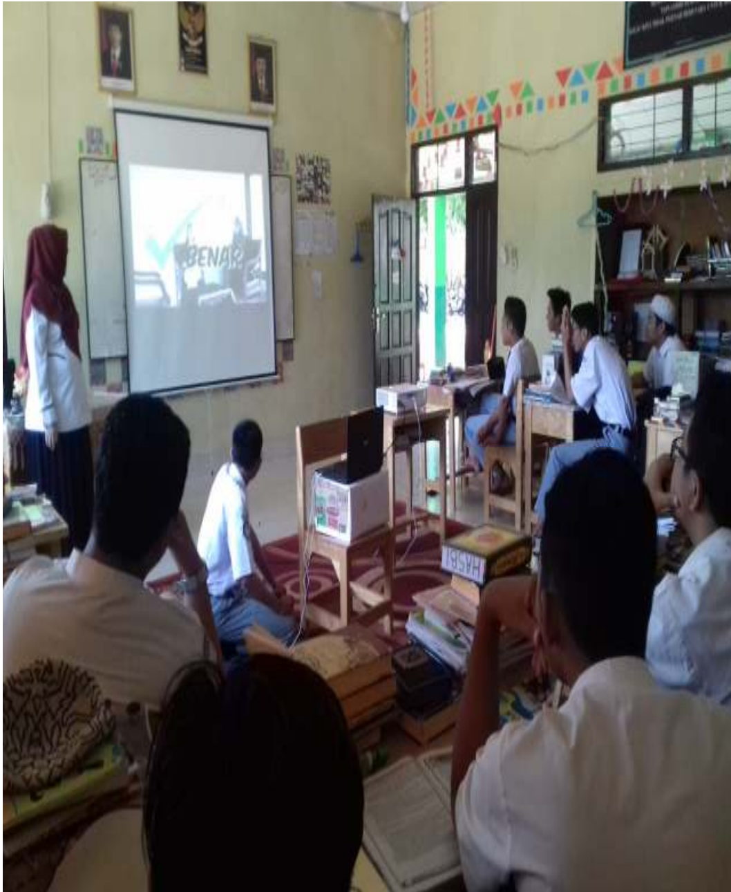
Penggunaan media pada pembelajaran akidah akhlak di kelas XI Agama (MAPK) MAN 4 Banjar