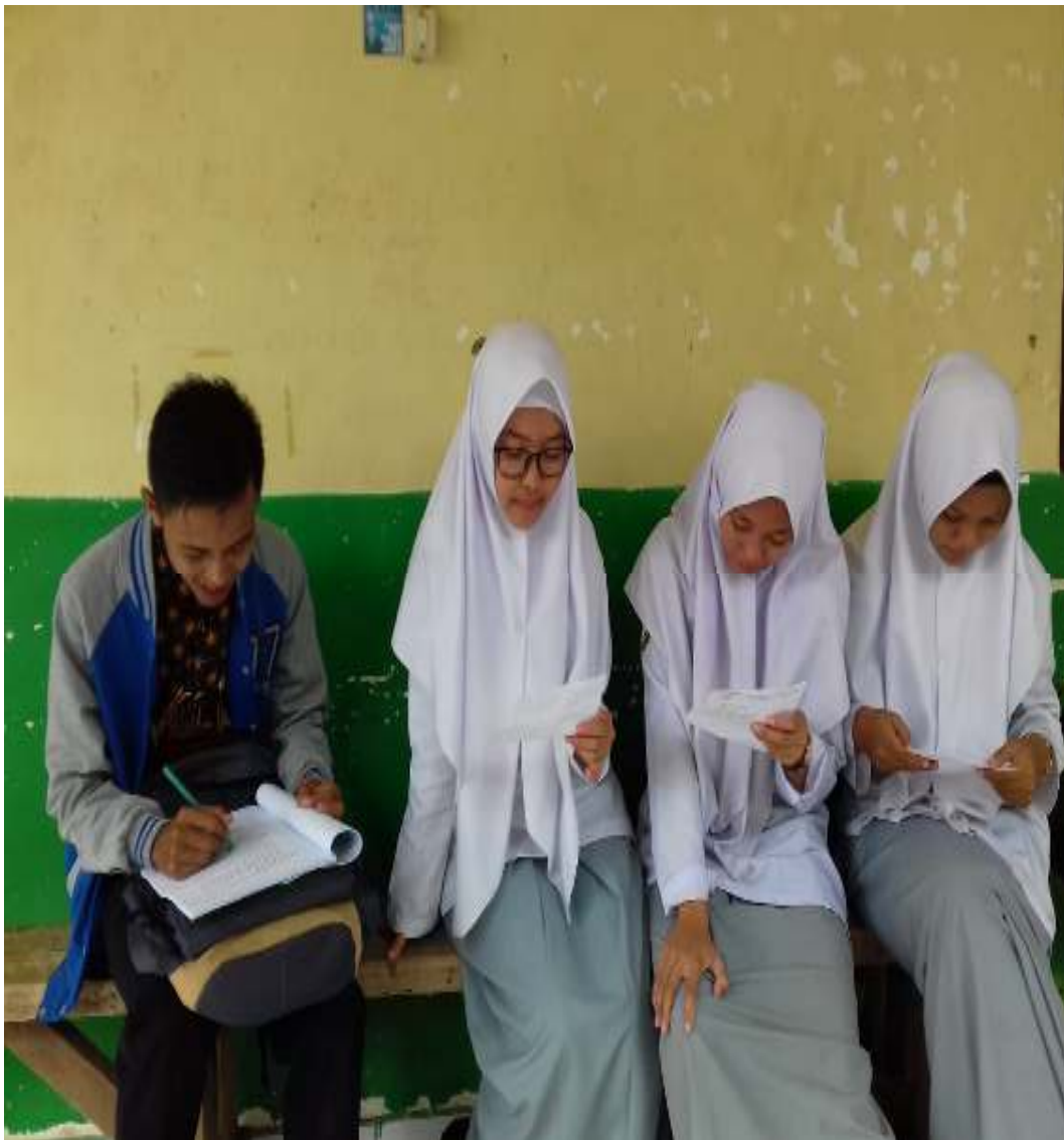
Saat mewawancarai kelas XI Bahasa MAN 4 Banjar