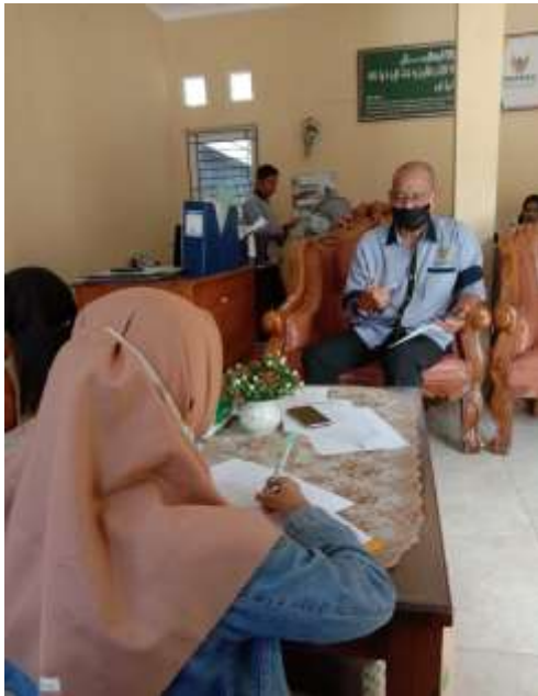
Foto saat wawancara dengan wakil ketua IV bidang kesekretariatan, sdm & umum