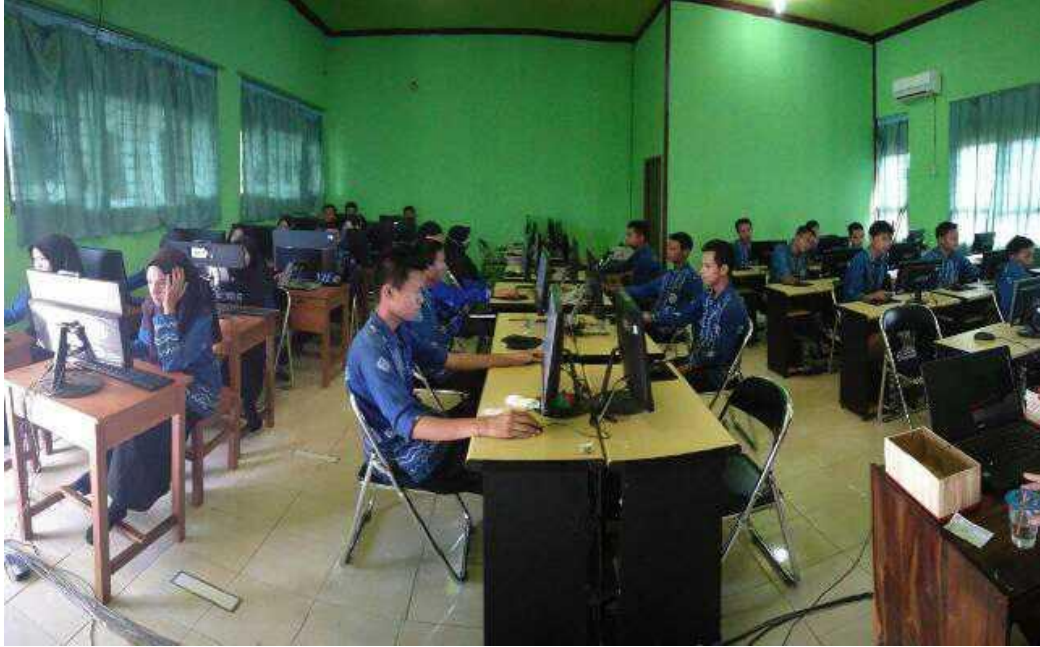
Gambar IV. Lingkungan SMAN 1 Bati-Bati