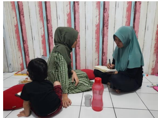
Wawancara dengan Lis