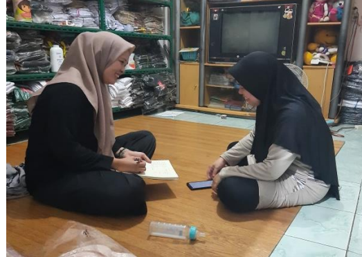
Wawancara dengan Ibu RT