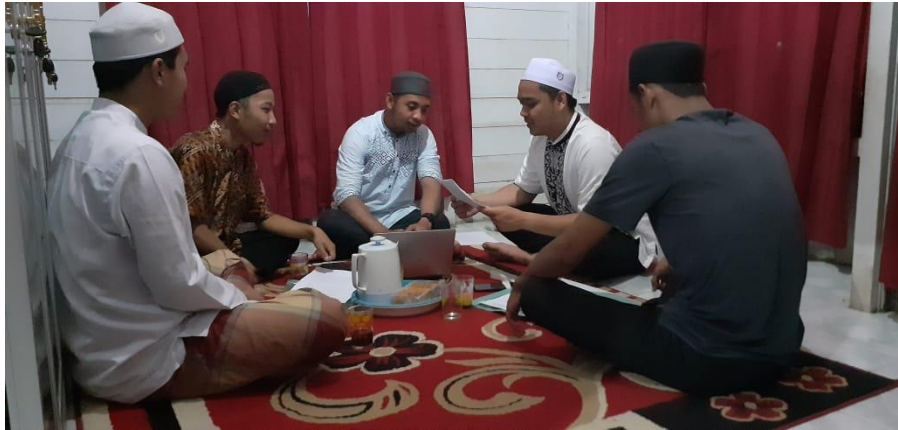
Wawancara dengan para jamaah majelis Taklim Al-Ikhlas