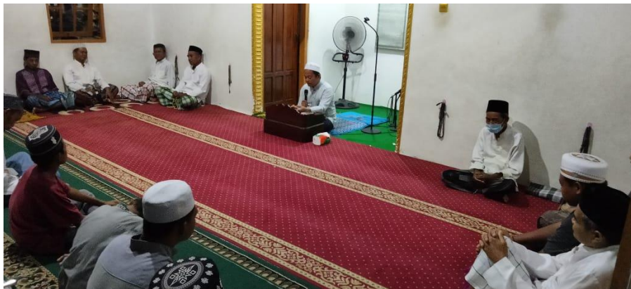
Kegiatan pengajian di majelis taklim Al-Ikhlas