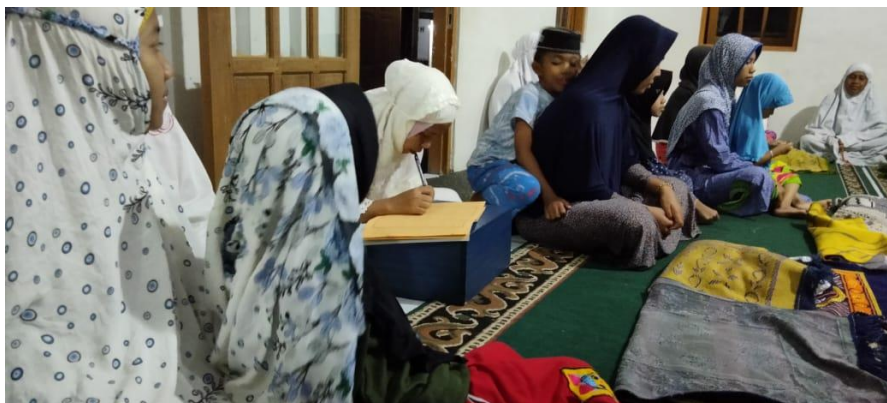
Kegiatan pengajian di majelis taklim Al-Ikhlas