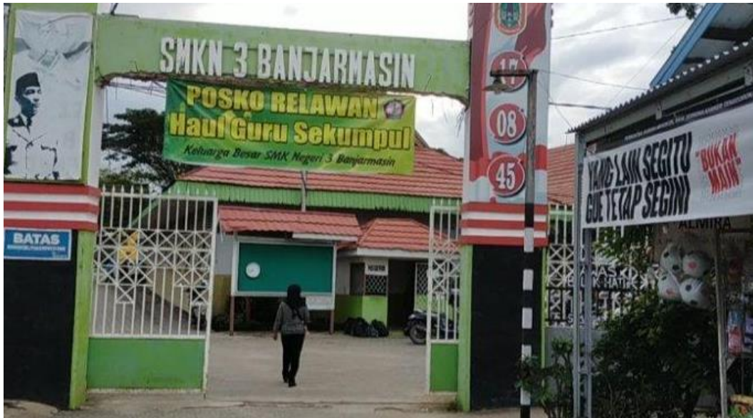
Gambar 4.3 SMKN 3 Banjarmasin 2

Visi dari SMKN 3 Banjarmasin adalah mencetak alumni yang mempunyai wawasan iptek dan imtaq, memiliki jiwa kewirausahaan dan memiliki wawasan lingkungan.