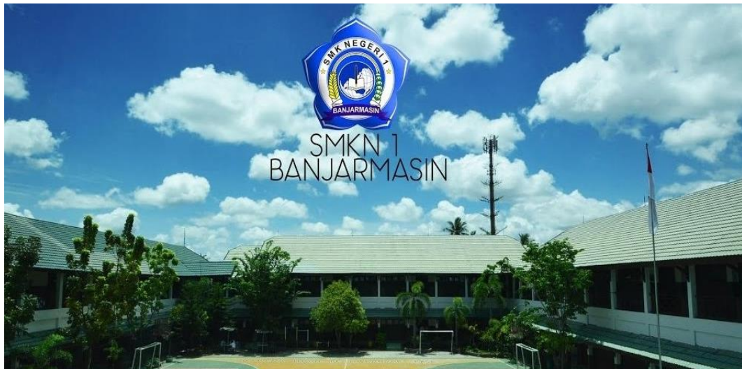
Gambar 4.1 SMKN 1 Banjarmasin 1

SMKN 1 Banjarmasin ialah suatu sekolah kejuruan negeri yang terletak pada provinsi dari Kalimantan Selatan, suatu kabupaten dari kota Banjarmasin yang beralamatkan pada Mulawarman No. 45 Teluk Dalam. Sekolah ini bisa dilaksanakan penghubungan dengan fax (0511) 4368225 atau no.telp (0511) 4368225.