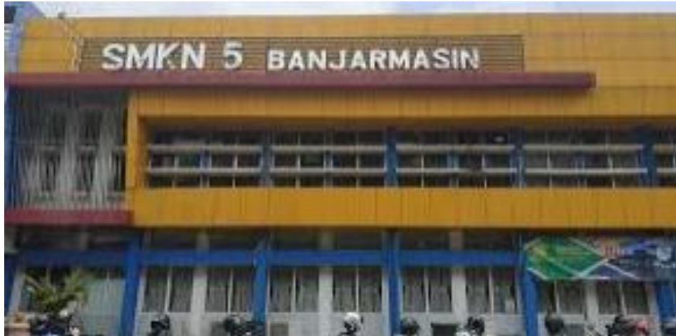
Gambar 4.5 SMKN 5 Banjarmasin 3

Visi dari SMKN 5 Banjarmasin menciptakan lulusan yang bertaqwa, beriman dan menguasai teknologi dan pengetahuan dan juga dapat melaksanakan persaingan di dalam dunia secara keseluruhan.