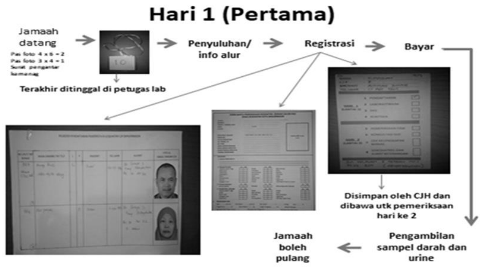
Gambar 4.3 hari Pertama Pemeriksaan Kesehatan Jemaah Haji