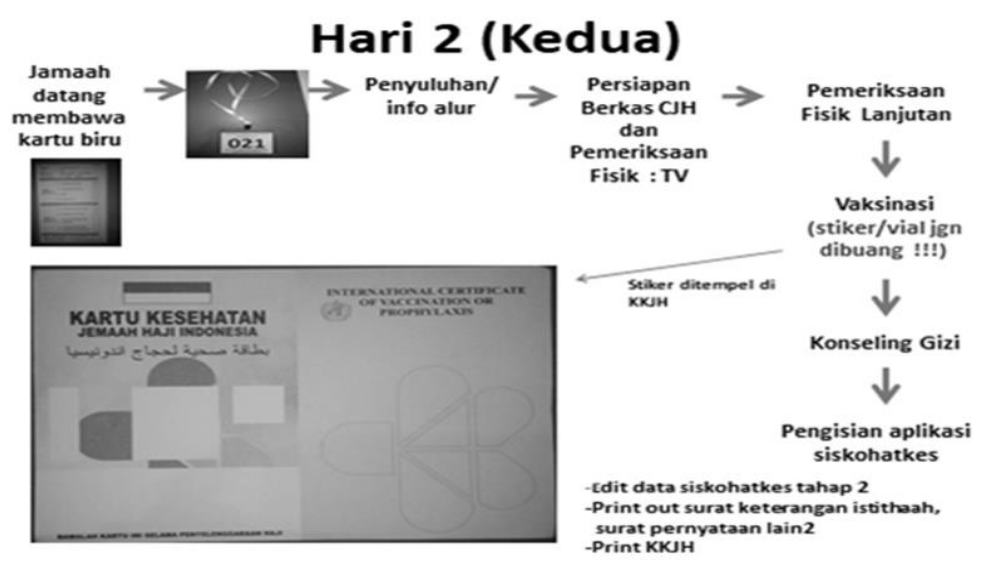
Gambar 4.4 hari Kedua Pemeriksaan Kesehatan Jemaah Haji