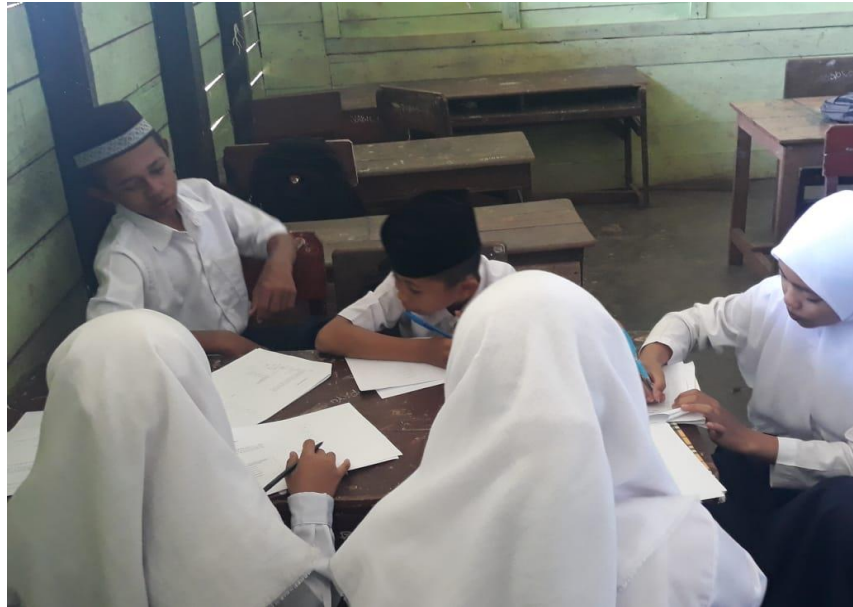
Gambar VI. Siswa berkelompok untuk berdiskusi