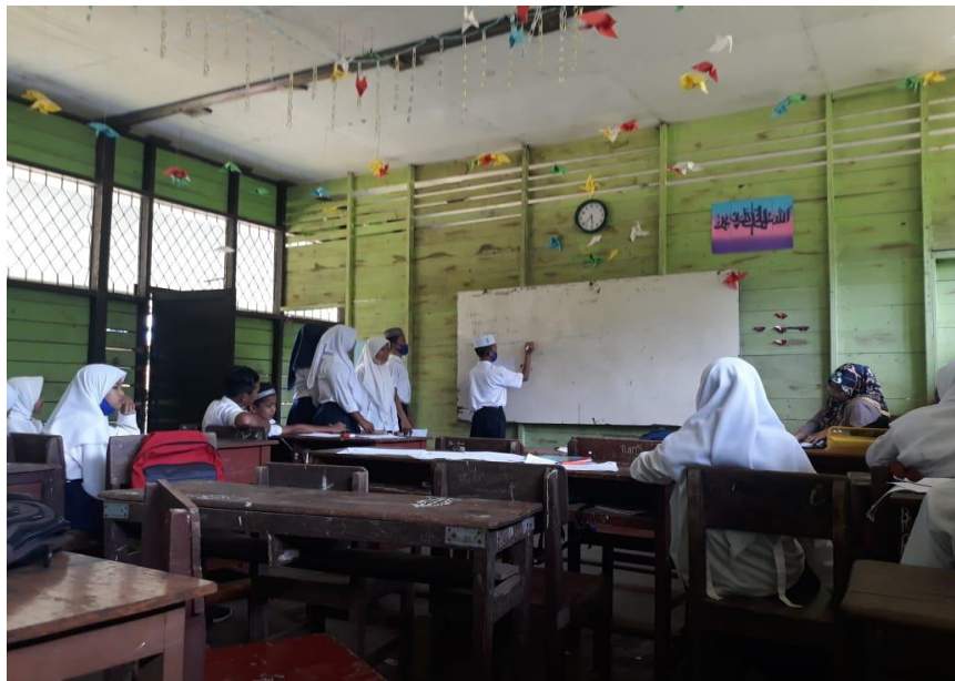
Gambar VII. Perwakilan kelompok maju untuk mempresentasikan hasil kelompoknya.