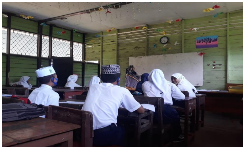
Gambar V. Guru meminta siswa untuk mengerjakan LKS secara mandiri dengan tahapan pemecahan masalah.