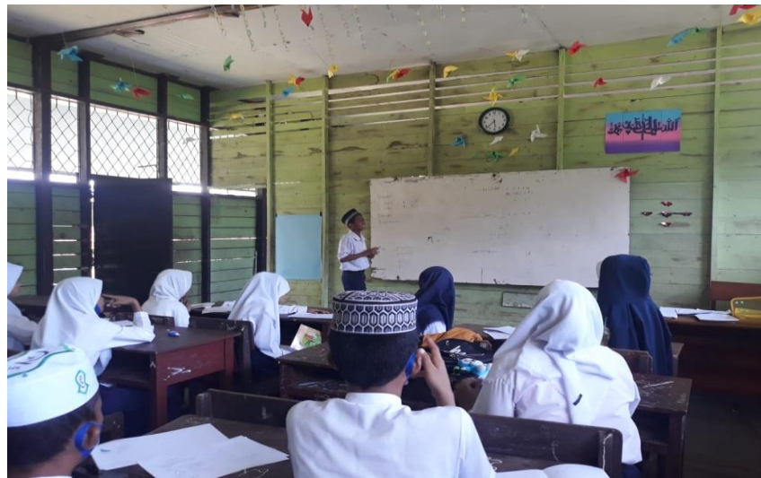
Gambar VIII. Siswa dibantu guru menyimpulkan materi.

dalam keadaan pandemi yang belum berakhir (Gambar VIII), tahap selanjutnya peneliti mengajak siswa berdoa dan menutup pembelajaran, kemudian terakhir peneliti mengucapkan salam.