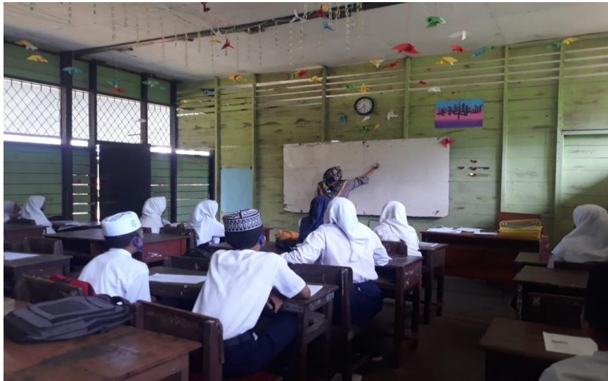
Gambar IV. Guru melakukan apersepsi bersama murid

yang maju dan mengarahkan siswa pada penyelesaian akhir masalah yang tepat.