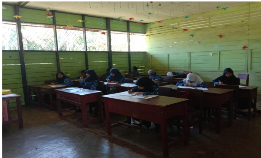
Gambar IX. Posttest

Pada pertemuan ketiga, siswa diminta untuk mengerjakan soal posttest (Gambar IX).