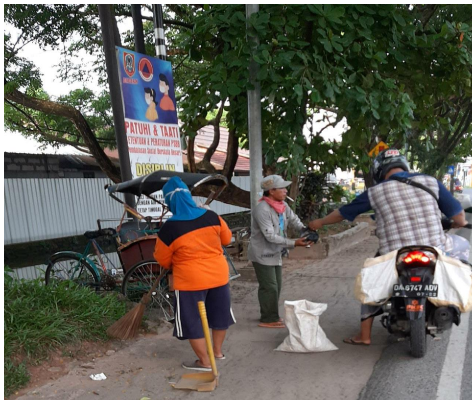
GAMBAR 4.3 Kegiatan Sosial

menerut para pengurus FKJK jika dibagikan pada hari Jum'at sudah banyak orang yang melakukan pembagian nasi bungkus.