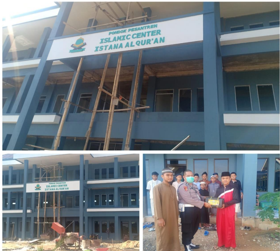
GAMBAR 4.2 Pembagian Al quran

Kegiatan ini dilakukan untuk membantu masjid dan musala hingga panti asuhan yang baru dibangun untuk diberikan Al quran dan perlengkapan alat shalat. Dengan adanya kegiatan ini sangat membantu para masyarakat dan memotivasi agar bergiat membaca Al quran.