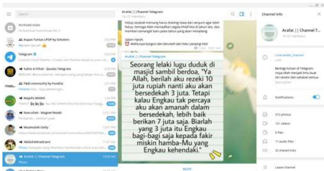
Gambar 5. Tampilan Telegram dan Channel @arafat_channel