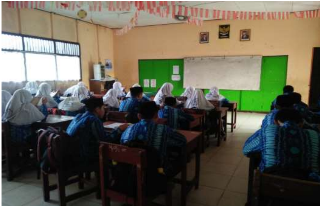
Observasi ruang guru di MTsN 3 Kota Banjarmasin pada hari tanggal 01 Februari 2020

Observasi membaca Alquran dikelas VIII di MTsN 3 Kota Banjarmasin, pada tanggal 30 Januari 2020