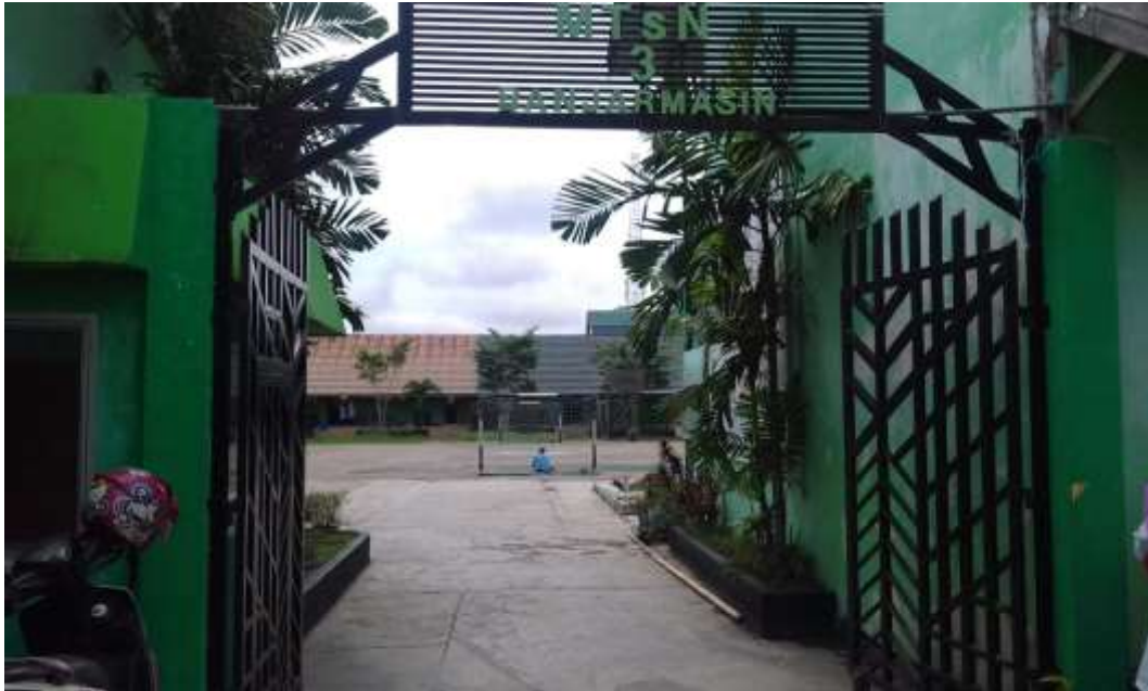
Observasi di lingkungan sekolah MTsN 3 Kota Banjarmasin pada hari tanggal 01