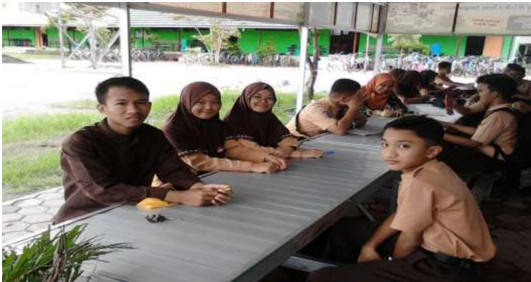
Wawancara dengan Peserta Didik Kelas VIII di MTsN 3 Kota Banjarmasin pada tanggal September 2020