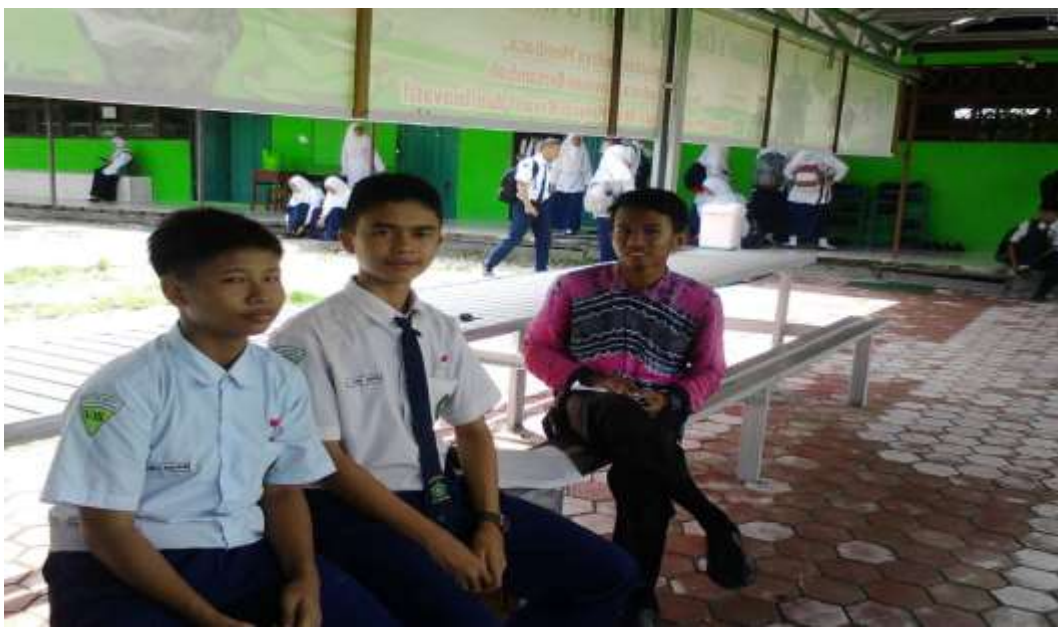
Wawancara dengan Peserta Didik Kelas VIIIB di MTsN 3 Kota Banjarmasin pada tanggal 29 September 2020