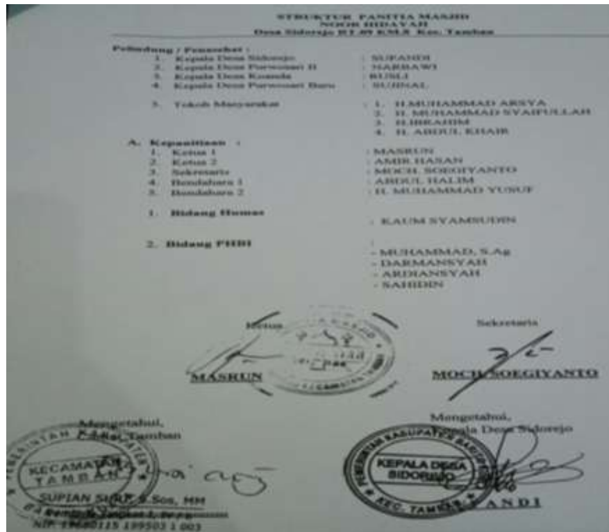
Gambar. 4.3 Struktur organisasi pengurus takmir Masjid Nor Hidayah Desa Sidorejo Kecamatan Tamban Kabupaten Barito Kuala