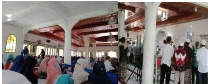
Gambar 4.4 Maulid Nabi Muhammad SAW

serta seksi pendidikan dan dakwah pengurus masjid Nor Hidayah bahwa memperingati hari-hari besar islam merupakan momen yang tepat dan efektif bagi Jemaah masjid Nor Hidayah untuk meningkatkan wawasan pengetahuan Islam, meningkatkan iman dan takwa serta ibadah amaliah yang dirasakan oleh mereka manfaatnya untuk memupuk kesadaran beragama dan berukhuwah Islamiyah sesama kita umat Islam. Menurutnya, dalam memperingati PHBI, yang sering diperingati adalah: kegiatan Idul Adha yang didalamnya terdapat kegiatan pemotongan hewan qurban dan membagikannya terutama kepada Jemaah masjid dan selebihnya kepada masyarakat Islam sekitarnya, peringatan Maulid Nabi Muhammad SAW, peringatan Isra Mi'raj, kegiatan halal-bihalal, bahkan terkadang memperingati tahun baru Islam. Masing-masing kegiatan.