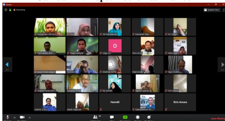
Gambar III. Rapat Koordinasi via zoom

Selain itu Balai Diklat Keagamaan Banjarmasin juga memiliki beberapa aplikasi yang digunakan dalam penyelenggaraan diklat, yaitu sebagai berikut ini.