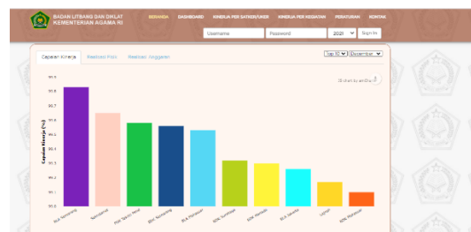
Gambar VII. Aplikasi SIPPA

Dengan aplikasi ini, perusahaan penerbit, lembaga pemerintah, dan yayasan dapat mengajukan permohonan surat tanda tashih dan surat izin edar untuk Al-Qur'an yang edarkan di Indonesia, dan masyarakat dapat melaporkan aduan seputar mushaf Al-Qur'an dan mengecek Surat Tanda Tashih mushaf Al-Qur'an. 104