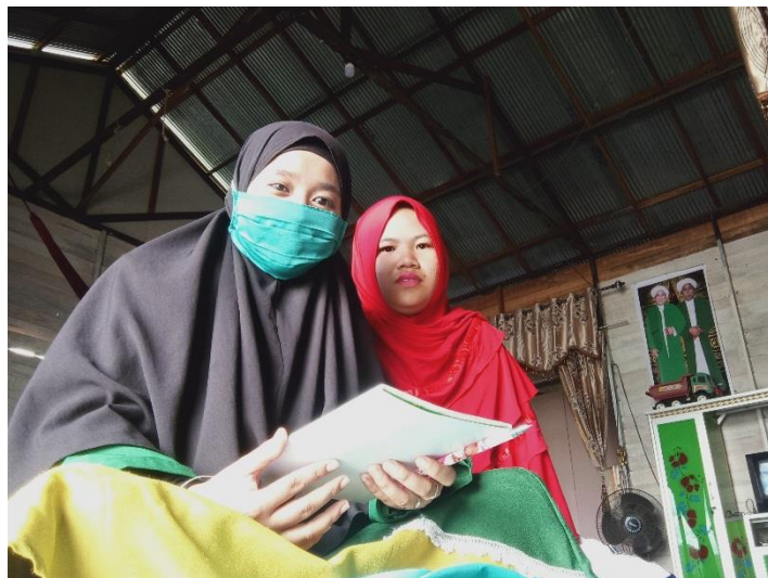
Wawancara dengan Ibu H (keluarga keempat subjek penelitian)