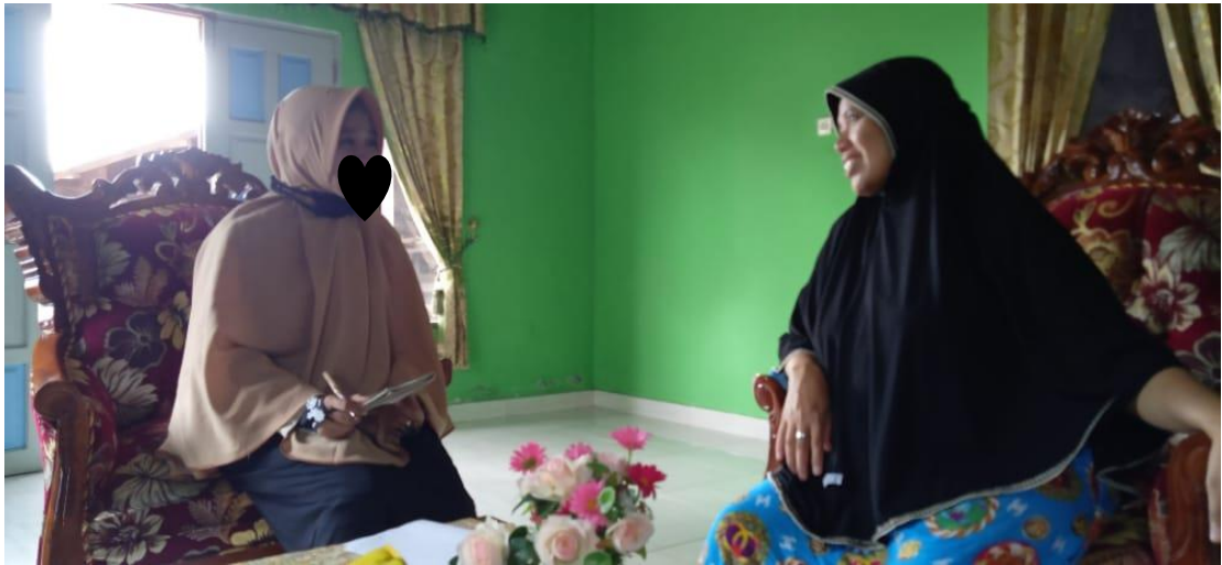
Wawancara dengan Ibu M (keluarga pertama subjek penelitian)