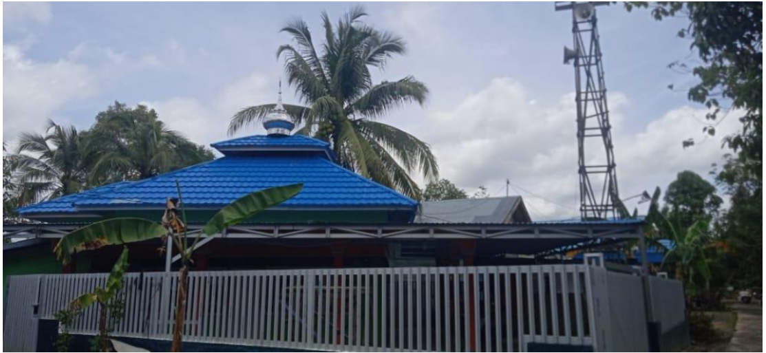
Musholla Darul Wusta