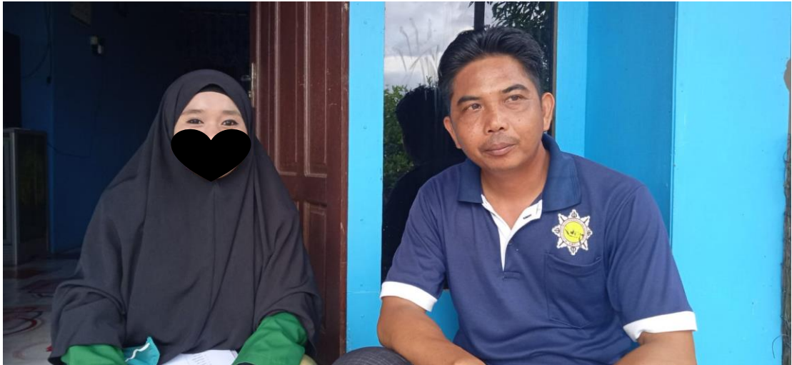
Wawancara dengan Bapak H (keluarga kelima subjek penelitian)