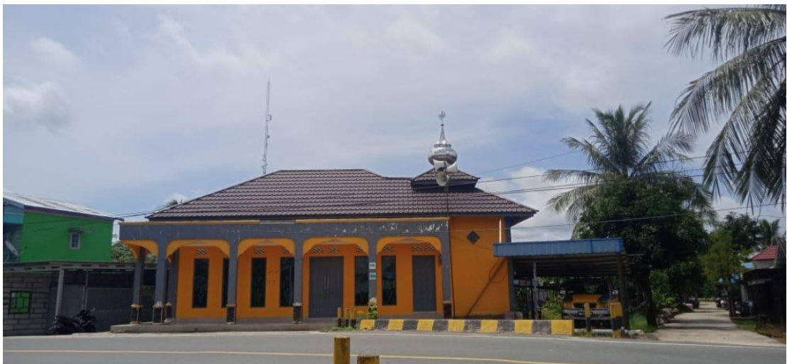
Musholla Nurul Huda