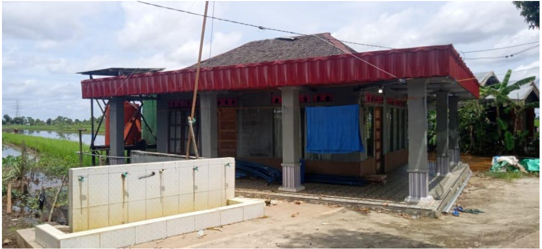
Musholla Nurul Hidayah