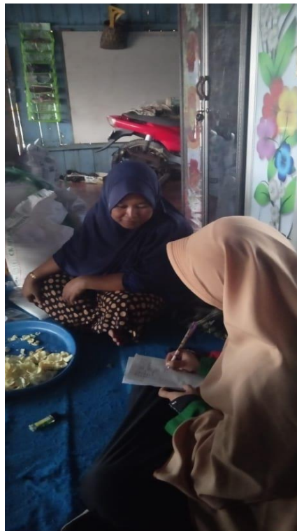
Wawancara dengan Ibu W (keluarga kedua subjek penelitian)