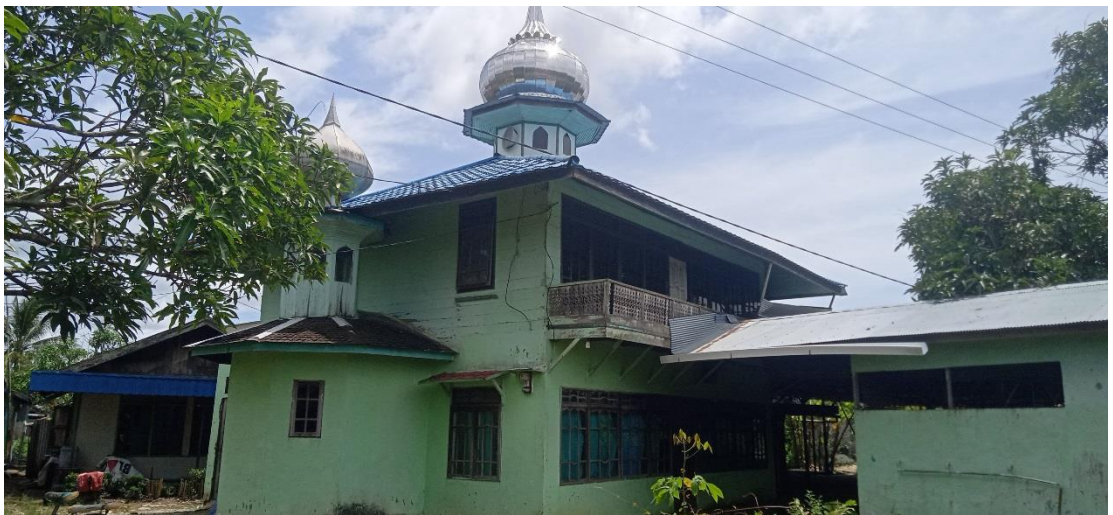
Musholla Darul Muhajirin