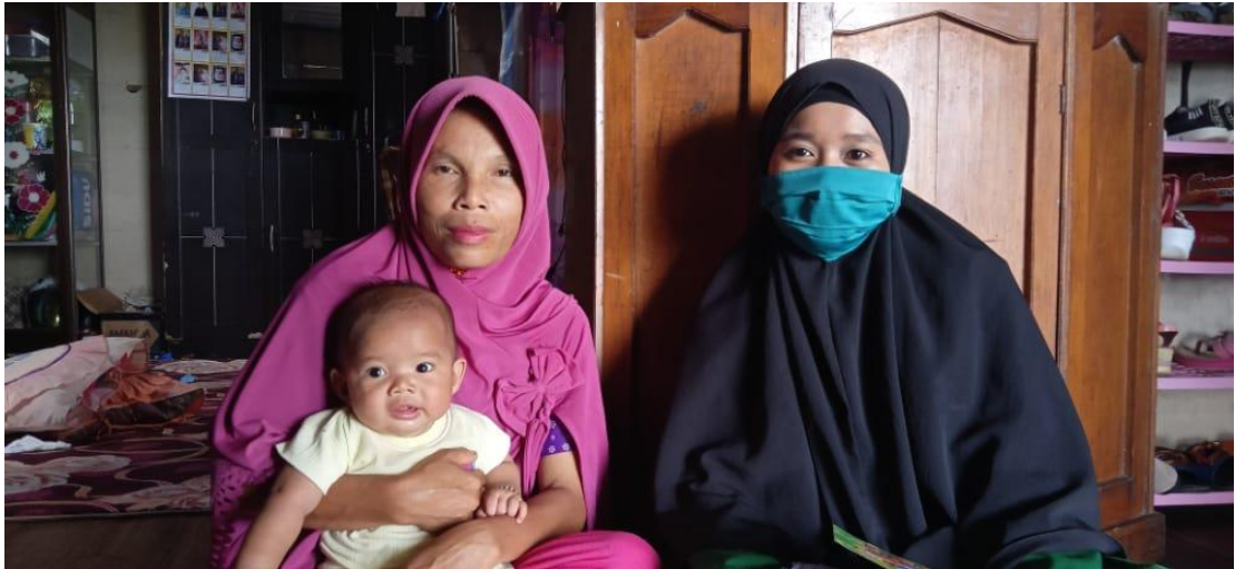
Wawancara dengan Ibu J (keluarga ketiga subjek penelitian)