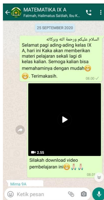
Gambar II. Pemberian Materi Pembelajaran Via WhatsApp

Pelaksanaan pembelajaran pada kegiatan awal diawali dengan peneliti mengucapkan salam, mengajak siswa berdo'a, serta mempresensi kehadiran siswa untuk mengetahui siswa yang tidak hadir pada hari itu. Kemudian peneliti menyampaikan judul pembelajaran dilanjutkan dengan penyampaian tujuan pembelajaran.