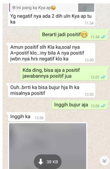
Gambar I. Menjawab Pertanyaan Siswa Via WhatsApp

Pada tahap ini, peneliti menyajikan materi tentang bentuk umum fungsi kuadrat dan nilai optimum fungsi kuadrat melalui video pembelajaran. Setelah beberapa menit, peneliti mempersilahkan kepada siswa untuk bertanya tentang hal-hal yang belum dipahami terkait materi pembelajaran. Tahap selanjutnya peneliti menjawab dan menjelaskan kembali pertanyaan-pertanyaan yang diberikan siswa.