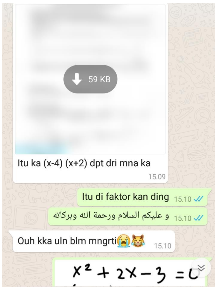
Gambar III. Menjawab Pertanyaan Siswa Via WhatsApp

Pada tahap ini, peneliti menyajikan materi tentang grafik fungsi kuadrat melalui video pembelajaran. Setelah beberapa menit, peneliti mempersilahkan kepada siswa untuk bertanya tentang hal-hal yang belum dipahami terkait materi pembelajaran. Tahap selanjutnya peneliti menjawab dan menjelaskan kembali pertanyaan-pertanyaan yang diberikan siswa.