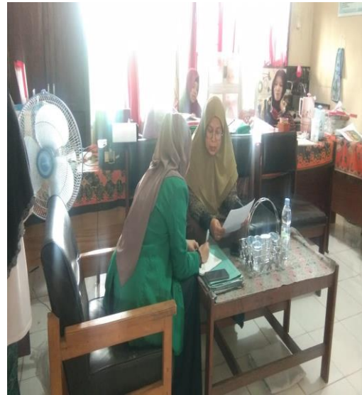
Wawancara dengan wali kelas V