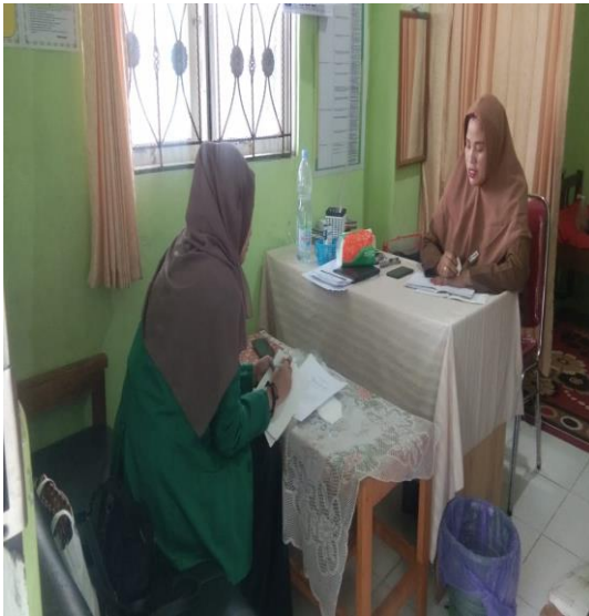
Wawancara dengan kepala sekolah