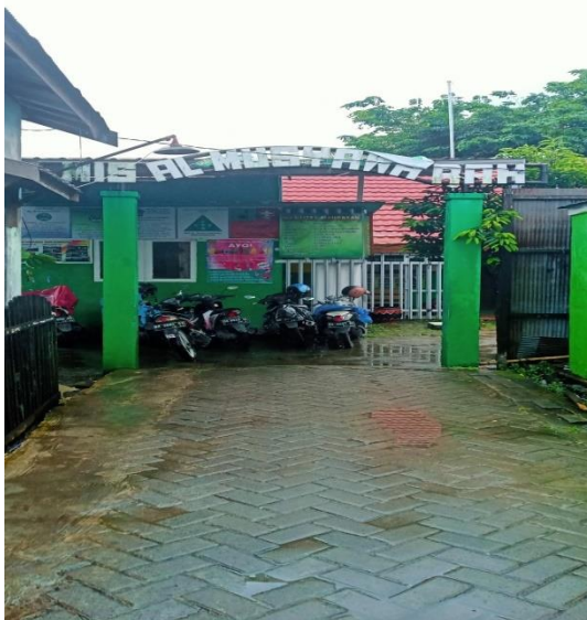
Sekolah Mis Al-Musyawah