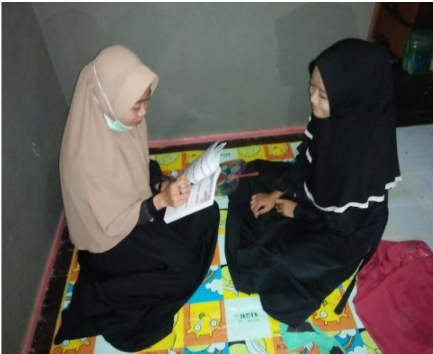
FOTO BERSAMA INFORMAN