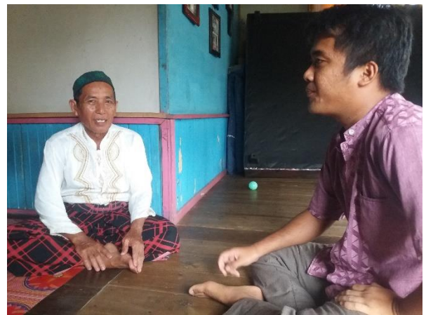
Foto Peneliti Dengan Kader