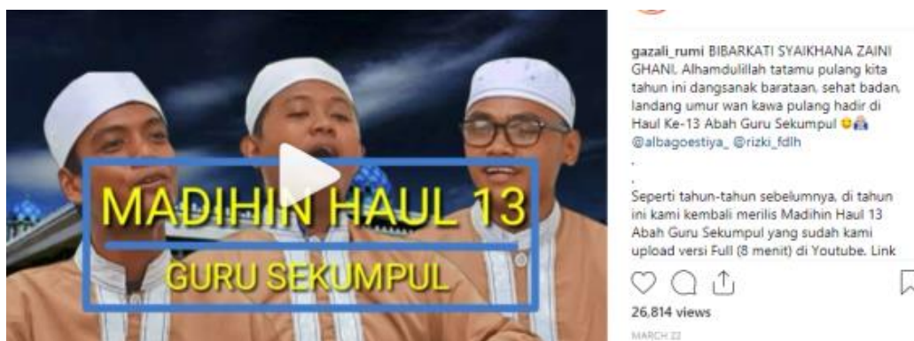
Gambar 4.5 Potongan Gambar video Madihin Dari Instagram @gazali_rumi

Selain Madihin yang bertema humor, Madihin dakwah yang berkaitan dengan ketokohan juga menjadi daya tarik tersendiri bagi para pengguna Instagram. Seperti Madihin tentang haul guru sekumpul yang hampir setiap tahun selalu dibuat oleh akun @gazali_rumi saat menjelang hingga sesudah penyelenggaraannya. Bahkan Madihin yang bercerita tentang seorang tokoh ulama fenomenal Kalimantan tersebut dibuat dalam beberapa part atau bagian yang pada setiap bagiannya memiliki pesan nasihat kebaikan bagi penontonnya. Video tersebut juga mampu menyedot perhatian para penontonnya hingga 26.814 views , seperti Madihin yang berjudul “Madihin Haul 13 Guru Sekumpul” ( https://www.Instagram.com/p/BgnDhNuAv5a/ )