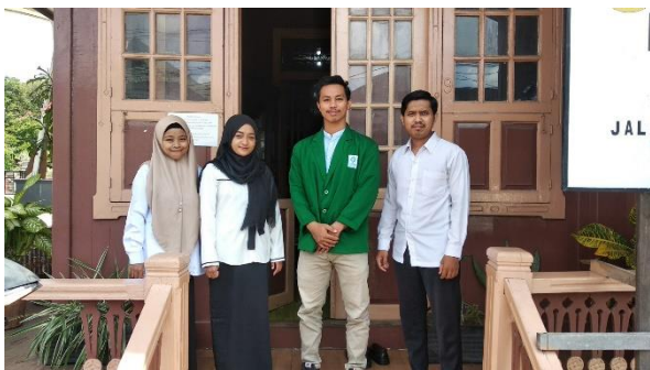
Gambar II Foto bersama Tenaga Pengadministrasi dan pelayanan perpustakaan umum kota Banjarmasin