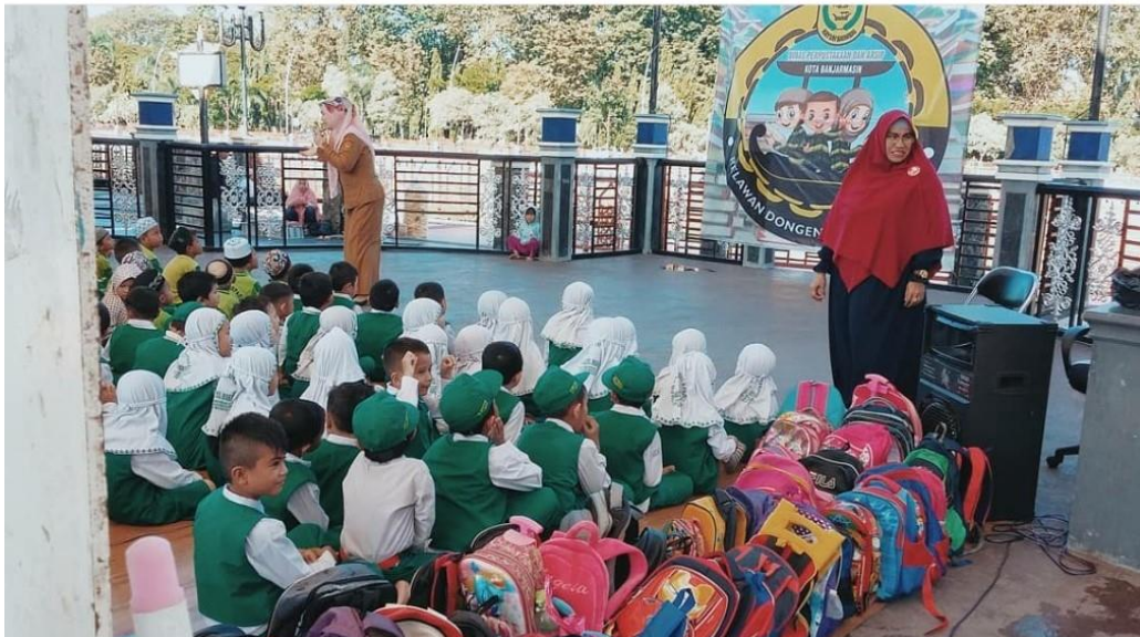
Gambar VII Kegiatan mendongeng yang di adakan disamping perpustakaan umum kota Banjarmasin, di siring menara pandang.