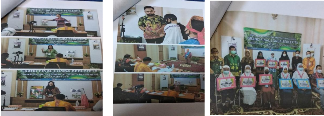
Gambar VI peserta-peserta juara lomba bercerita