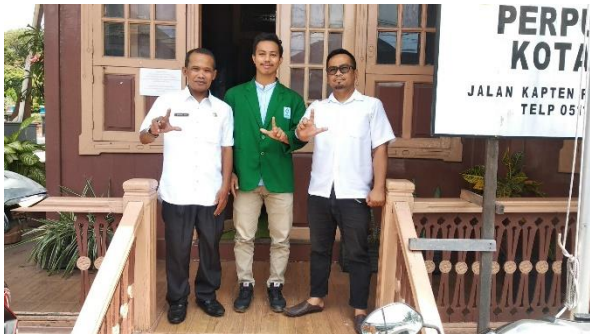
Gambar I Foto bersama Pustakawan Perpustakaan umum kota Banjarmasin