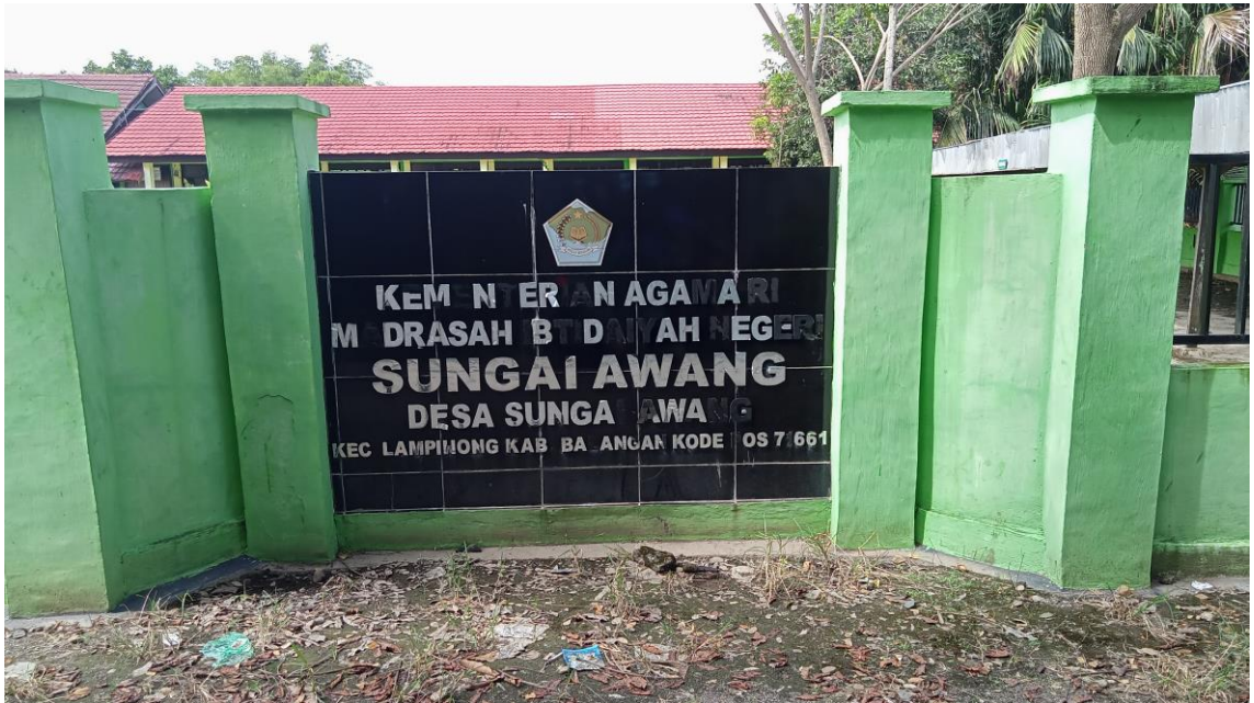
Bagian depan Madrasah