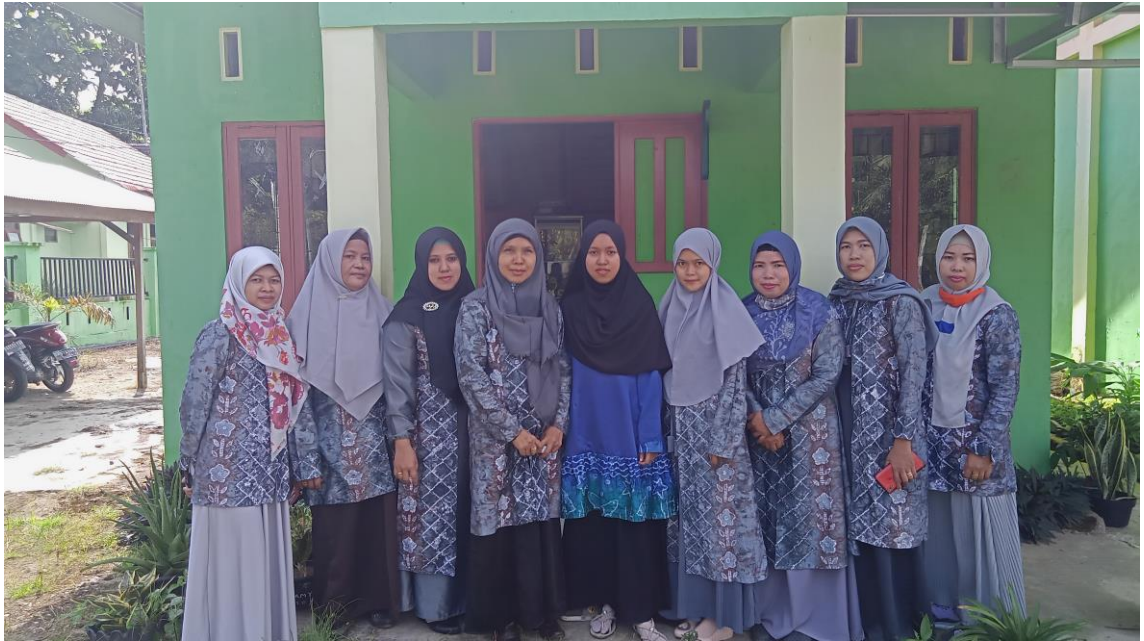
Bersama kepala madrasah dan guru-guru MIN 6 Balangan