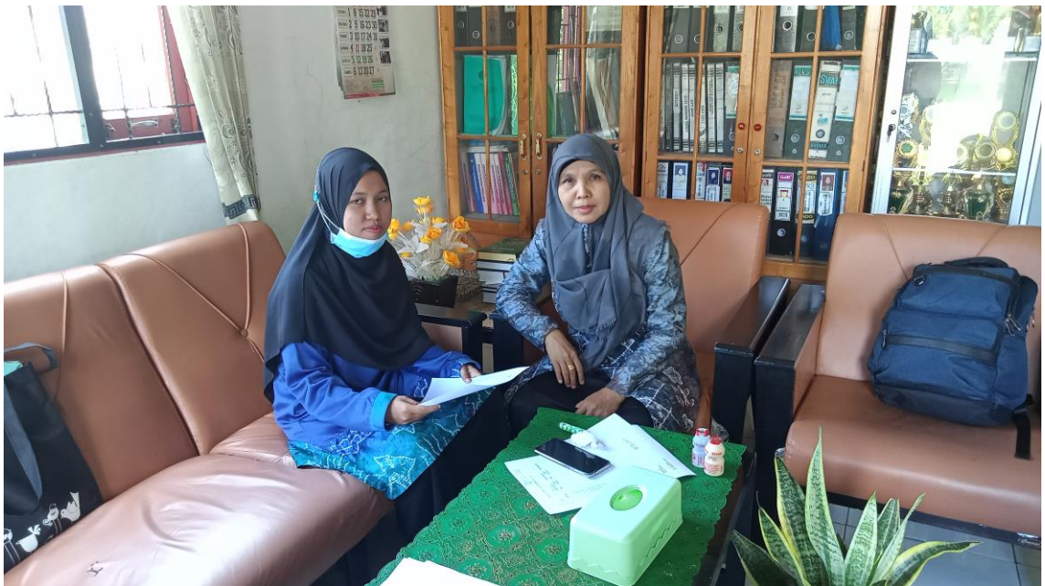
Wawancara bersama kepala madrasah