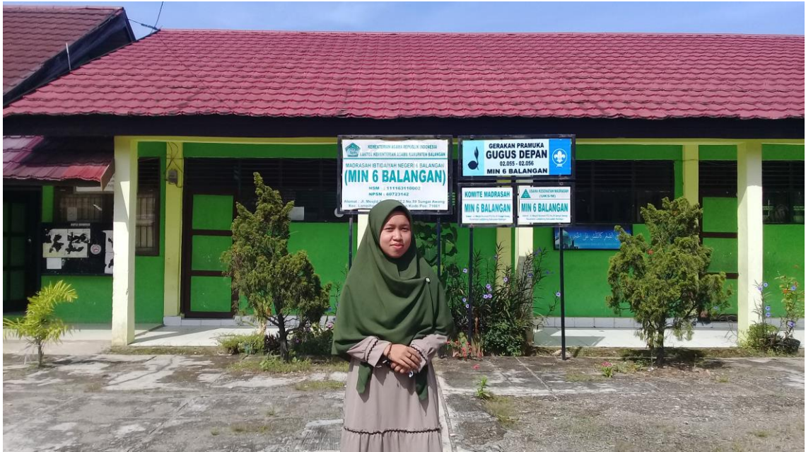
Penulis di MIN 6 Balangan