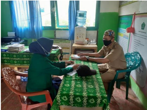
Foto-foto saat Penelitian