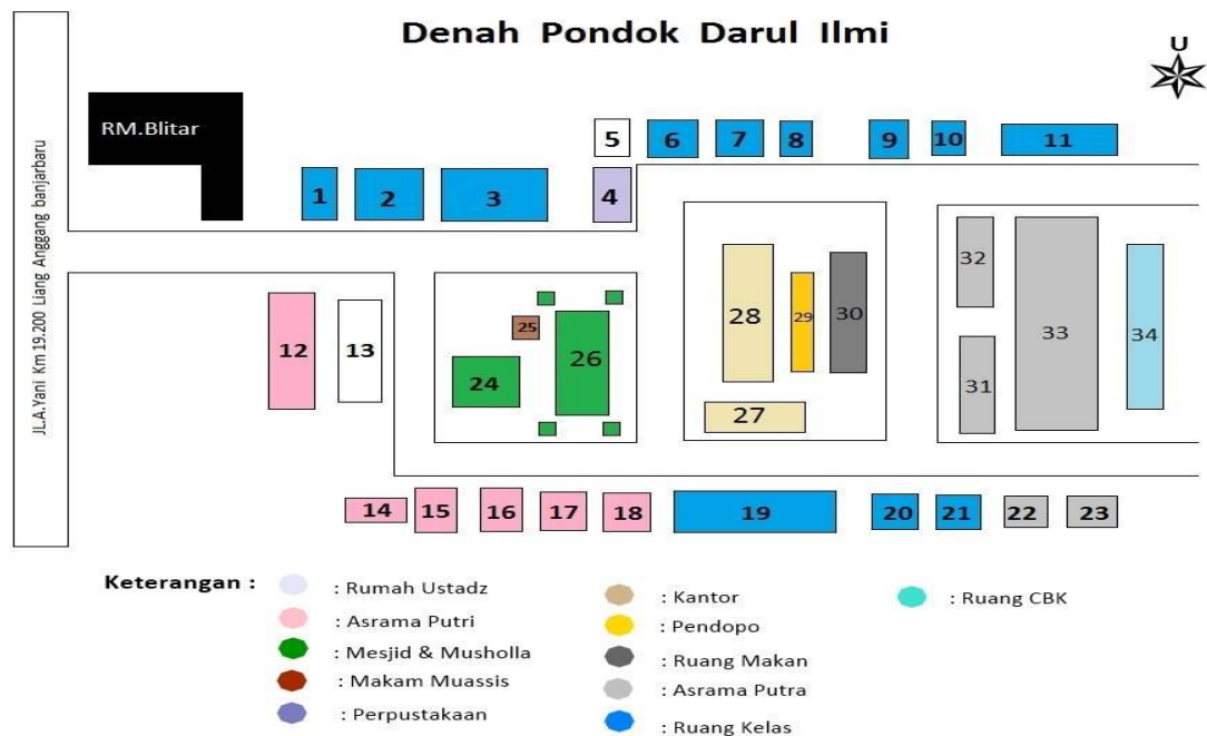
Gambar II. Denah Pondok Pesantren Darul Iلمي Tahun Pelajaran 2020/2021

Adapun yang menjadi perbatasan dari Pondok Pesantren Darul Iلمي adalah: