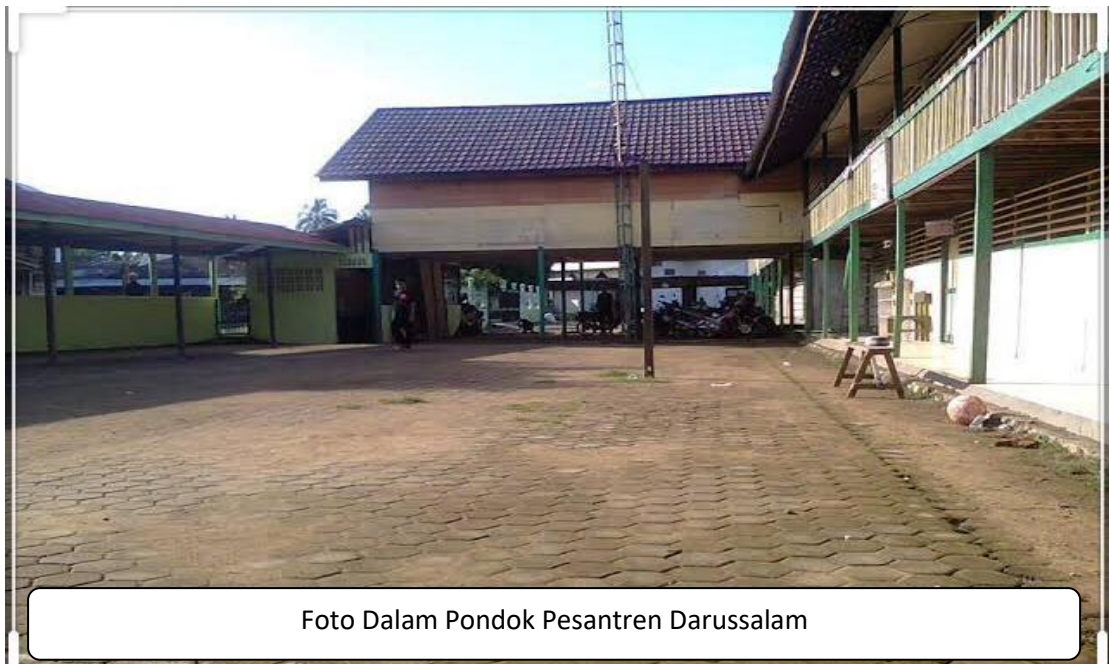
Foto Dalam Pondok Pesantren Darussalam