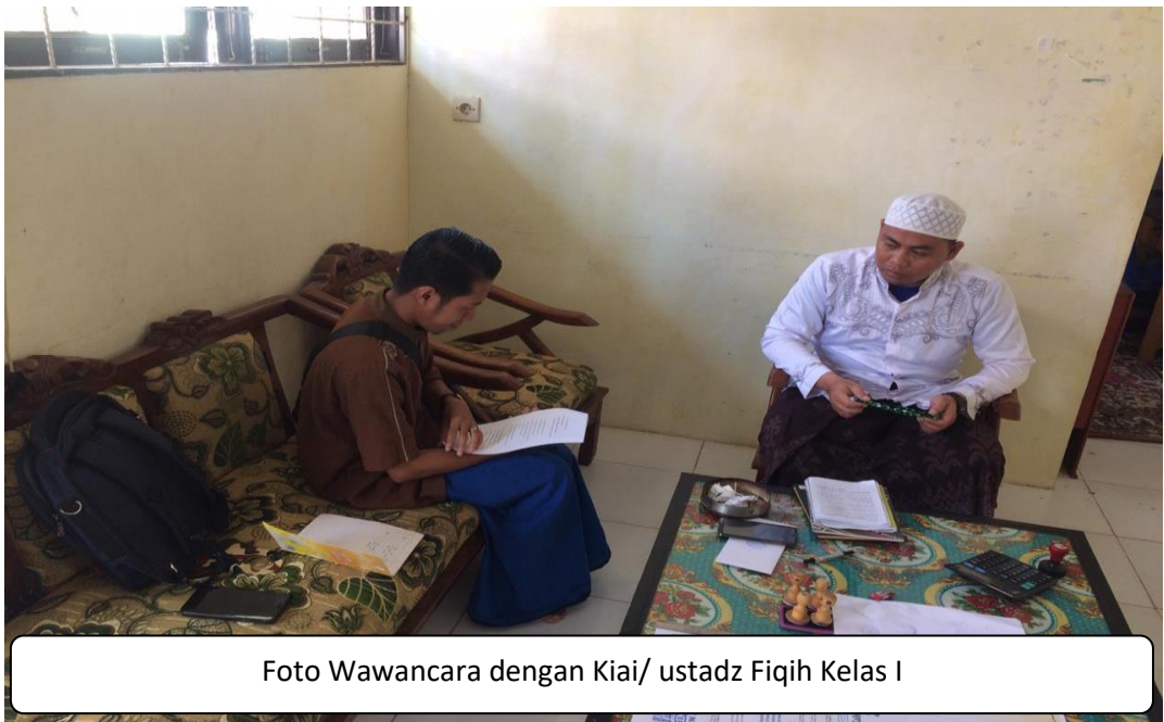
Foto Wawancara dengan Kiai/ ustadz Fiqih Kelas I