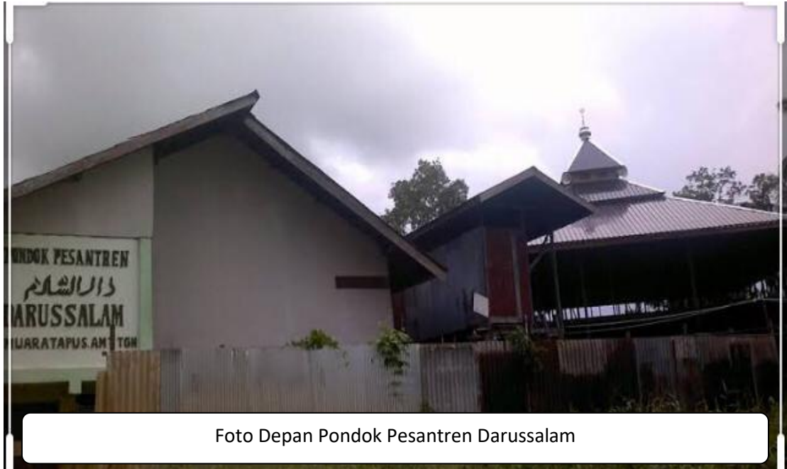
Foto Depan Pondok Pesantren Darussalam