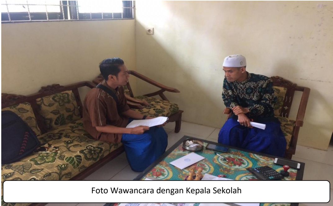
Foto Wawancara dengan Kepala Sekolah