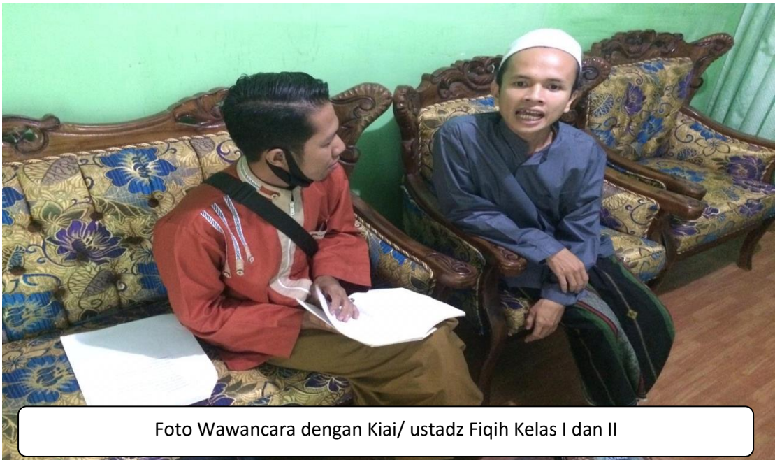
Foto Wawancara dengan Kiai/ ustadz Fiqih Kelas I dan II