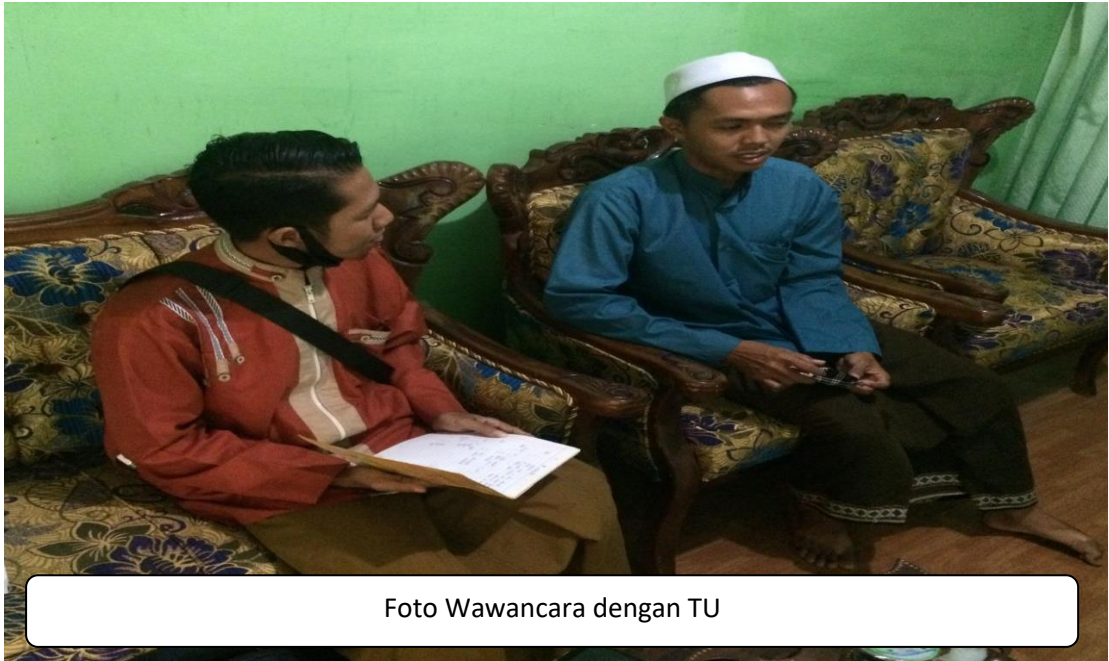
Foto Wawancara dengan TU