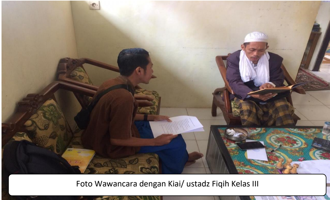
Foto Wawancara dengan Kiai/ ustadz Fiqih Kelas III