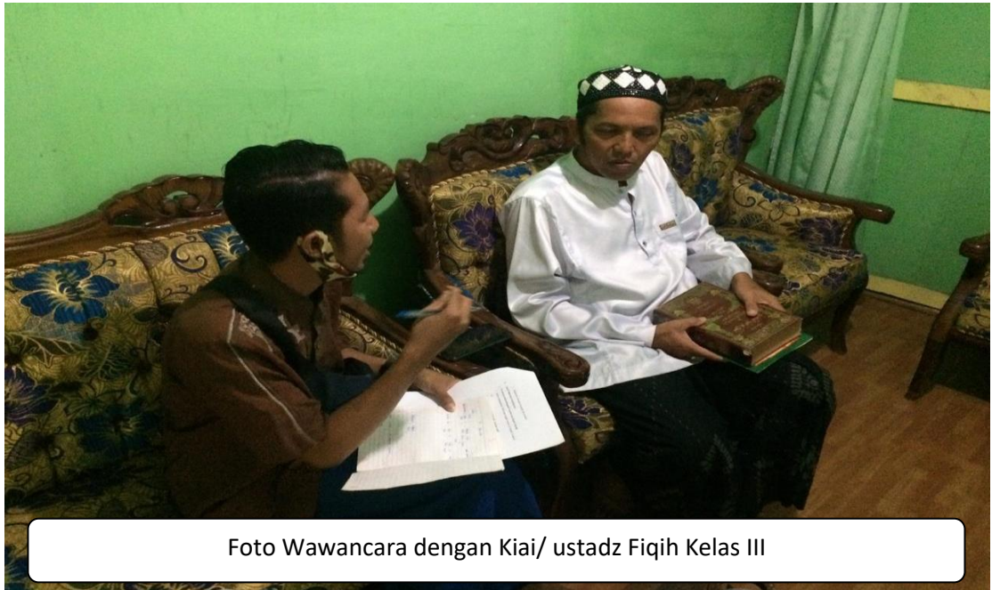
Foto Wawancara dengan Kiai/ ustadz Fiqih Kelas III