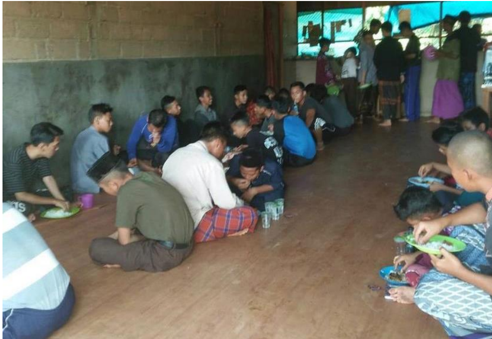
تناول الغداء في المطعم