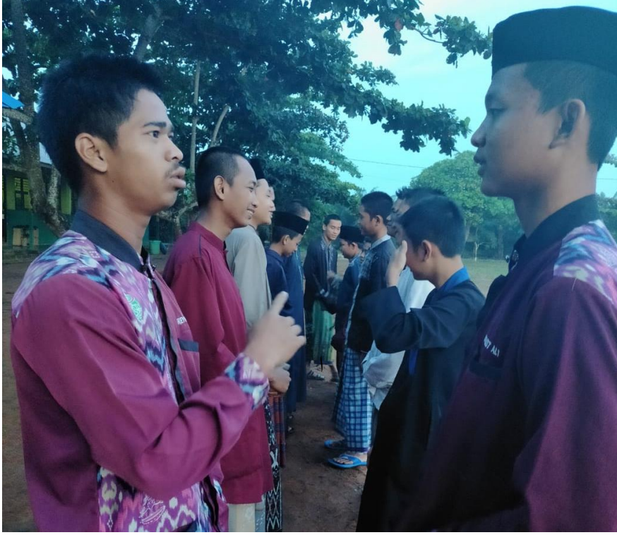
المحادثة الأسبوعية الواجبة تحت ملاحظة المدربين والأساتيد