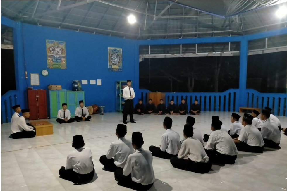
تدريب المحاضرة عند الطلاب