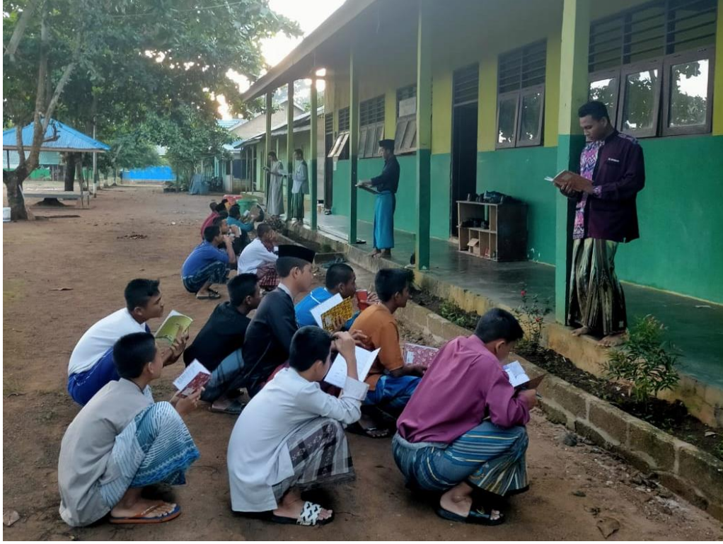
إعطاء المفردات في كل الصباح