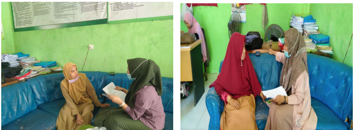
Dokumentasi Wawancara dengan Guru Wali Kelas I (Kanan) dan Guru Wali Kelas II (Kiri)