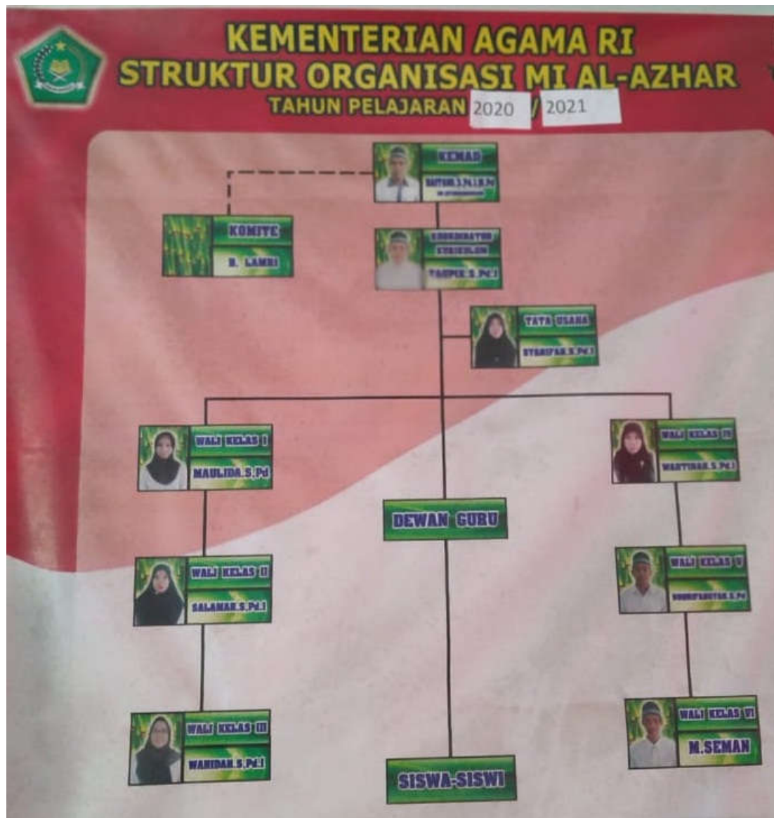
Dokumentasi Struktur Organisasi MI Al- Azhar