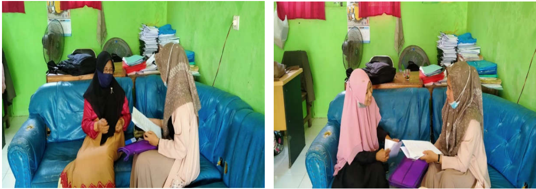
Dokumentasi Wawancara dengan Guru Wali Kelas III (Kanan) dan Guru Wali Kelas IV (Kiri)