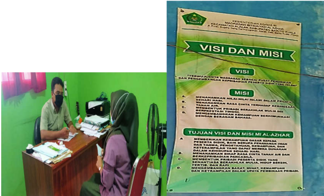
Dokumentasi Wawancara dengan Kepala Madrasah (Kanan) dan Visi dan Misi MI Al-Azhar (Kiri)