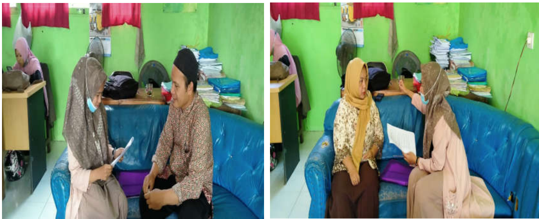
Dokumentasi Wawancara dengan Guru Wali Kelas V (Kanan) dan Guru Wali Kelas VI (Kiri)