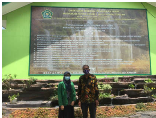
Dokumentasi bersama Kepala MAN 1 Hulu Sungai Tengah