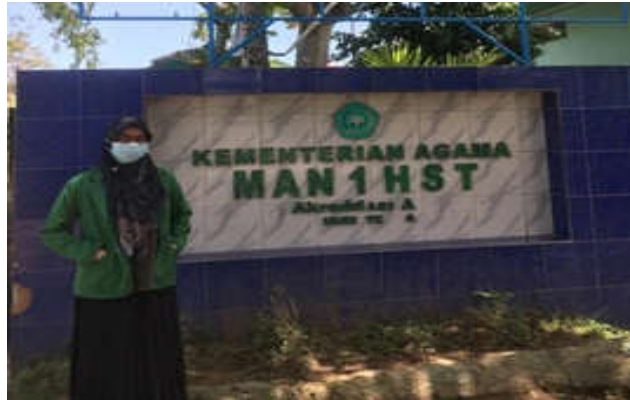
Dokumentasi saat penelitian di MAN 1 Hulu Sungai Tengah