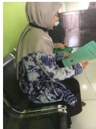
Dokumentasi dengan Tata Usaha saat Pengumpulan Data MAN 1 Hulu Sungai Tengah