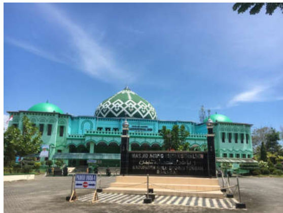
Dokumentasi Masjid yang berdekatan dengan MAN 1 Hulu Sungai Tengah yang biasa dijadikan sebagai tempat sholat berjamaah siswa