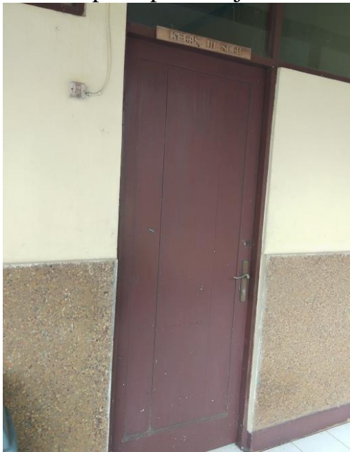
Foto Ruang Kelas (SDLB) Panti Sosial Bina Netra Fajar Harapan Martapura