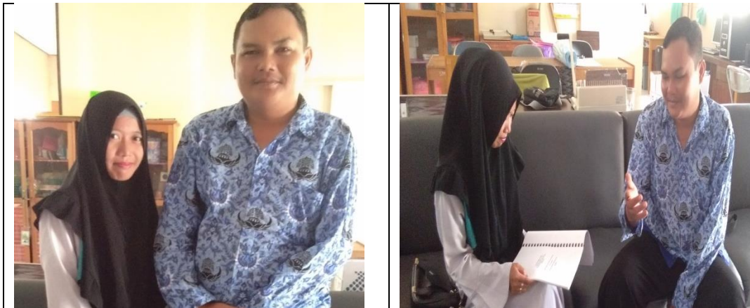
Foto wawancara bersama Guru kelas SLB-A Negeri 3 Martapura Fajar Harapan Martapura