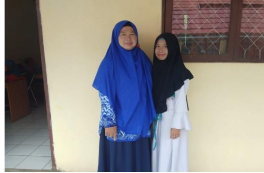
Foto bersama Guru kelas