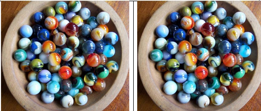
Foto keliring buat aktipitas pembelajaran