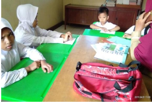
Foto aktifitas pembelajaran