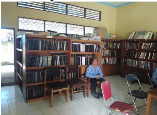
Foto Perpustakaan Sekolah SLB-A Negeri 3 Martapura Fajar Harapan Martapura