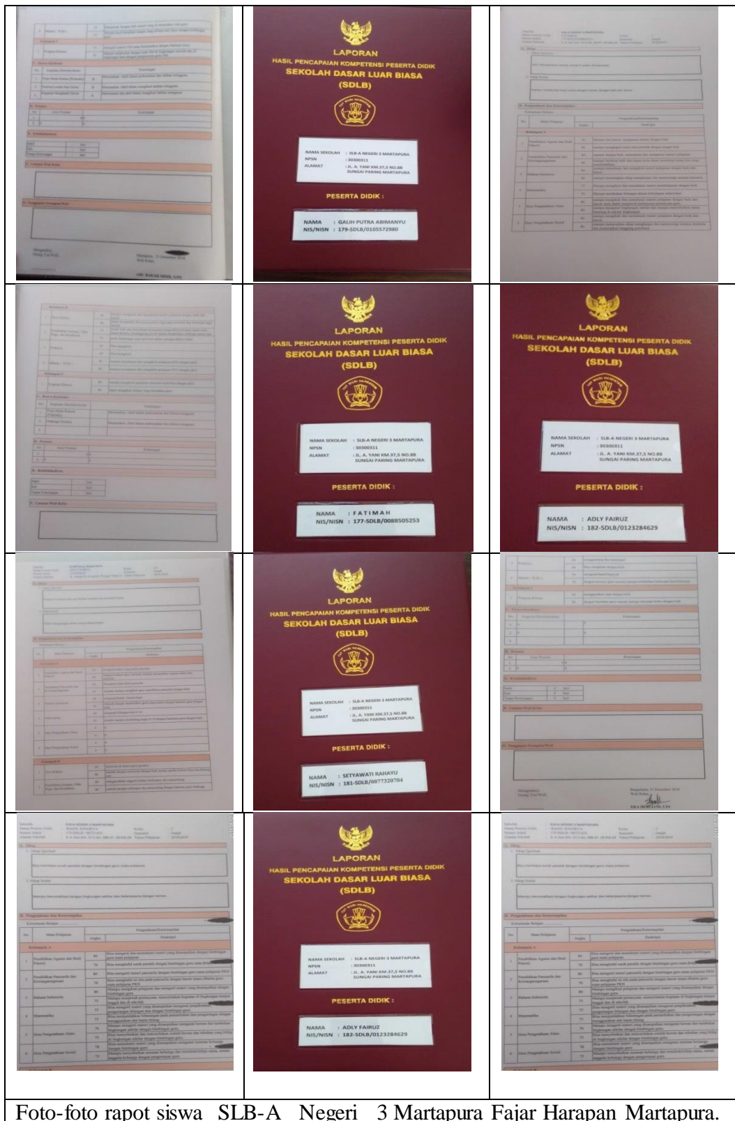
Foto-foto rapot siswa SLB-A Negeri 3 Martapura Fajar Harapan Martapura.