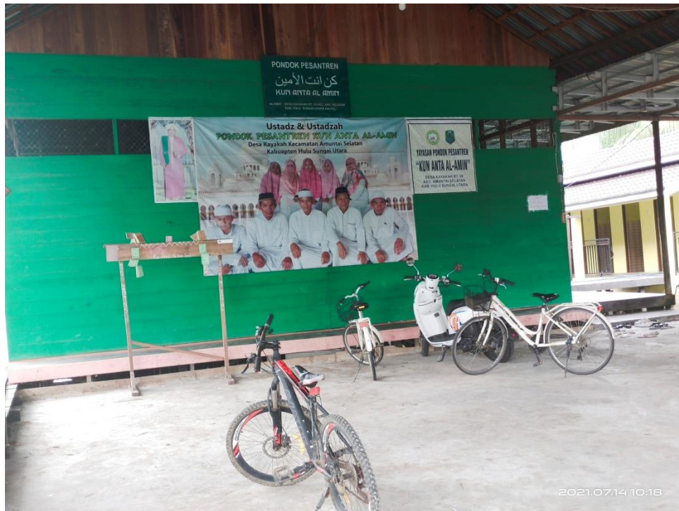
Kun Anta Al-Amin Islamic Boarding School and Islamic Junior High School