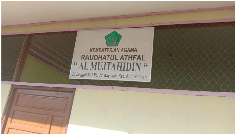
Al-Mujtahidin Islamic Kindergarden