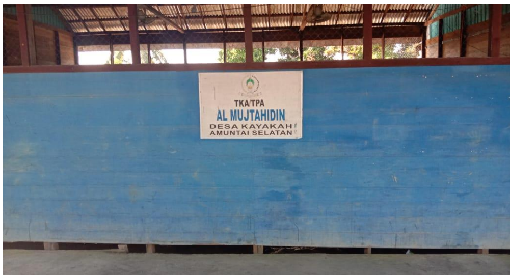
Al-Mujtahidin Quranic Kindergarden