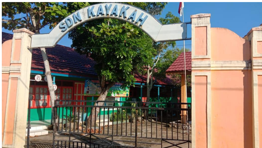
Kayakah State Elementary School