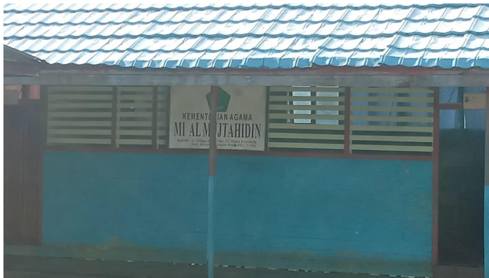
Al-Mujtahidin State Islamic Elementary School