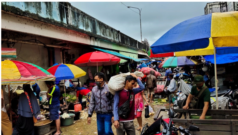
Suasana Pasar Sentra Antasari Banjarmasin