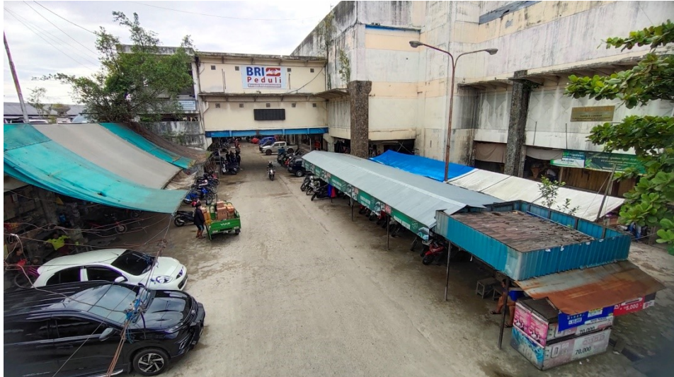
Suasana Pasar Sentra Antasari Banjarmasin