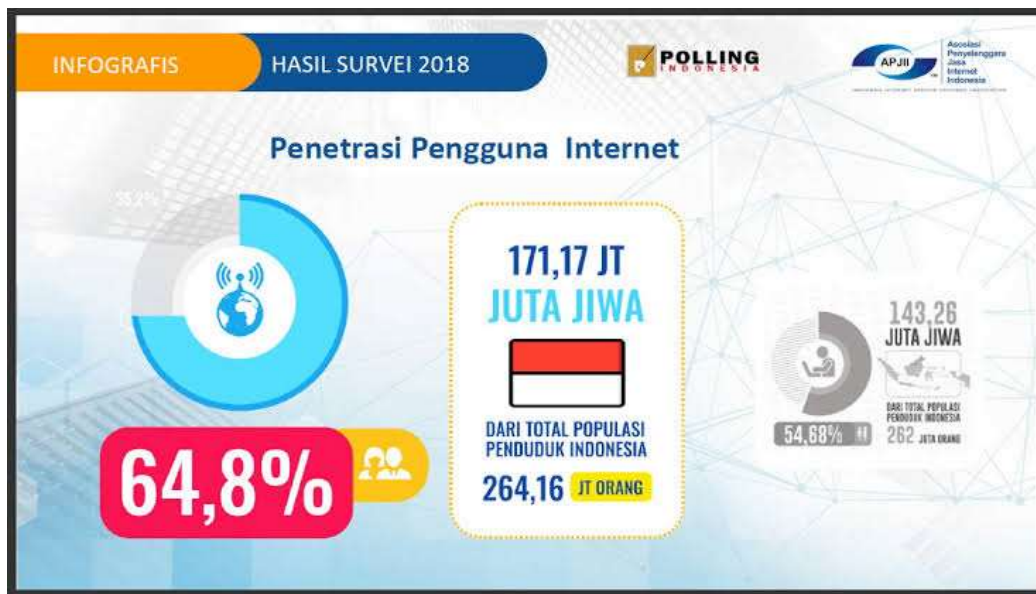
Gambar 1. 1 Jumlah Penetrasi Pengguna Internet di Indonesia