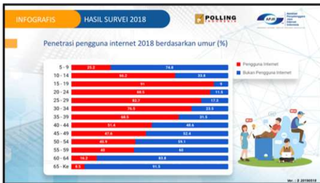
Gambar 1. 2 Hasil Survei Penetrasi Pengguna Internet berdasarkan Umur