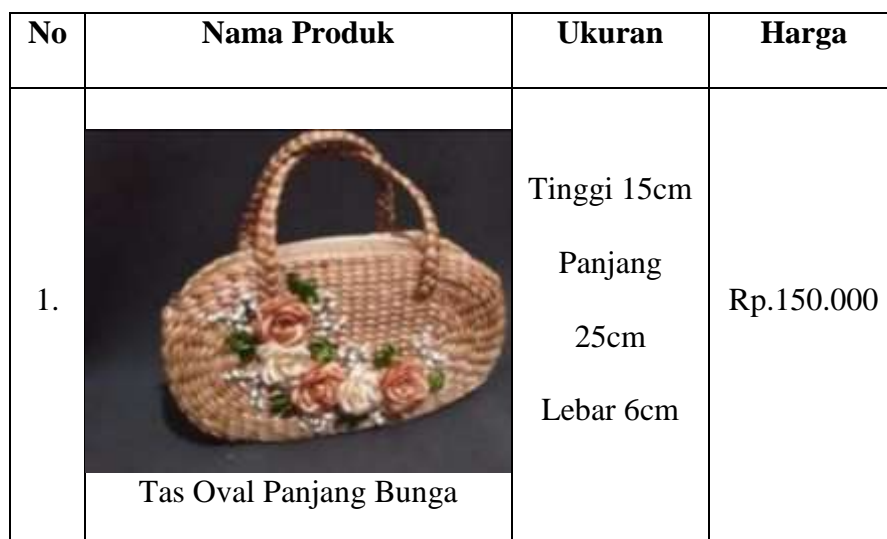
Tabel 4.2 Daftar Produk Kerajinan Tangan Mujisela Galery