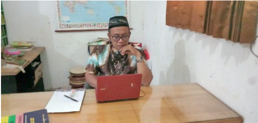
Halaman Depan Sekolah