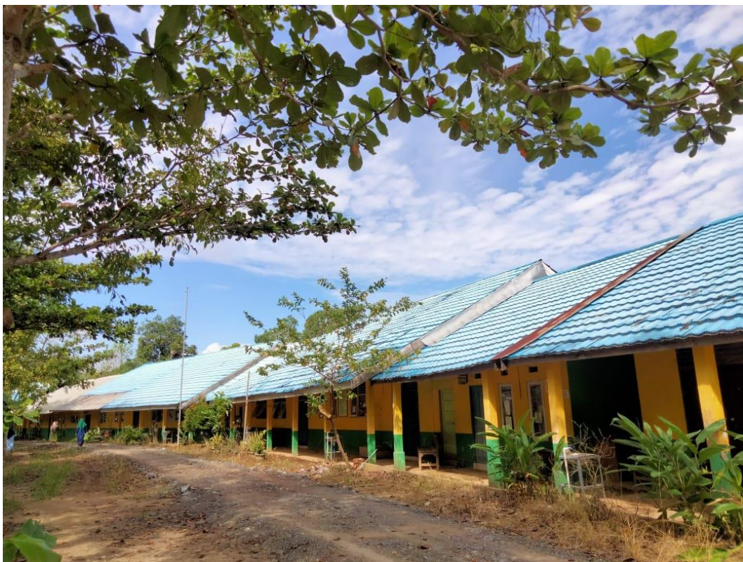
Ruang TU dan Kantor