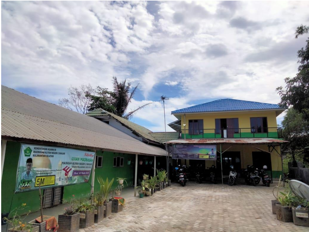
Thermogun (Pengukur Suhu Tubuh)