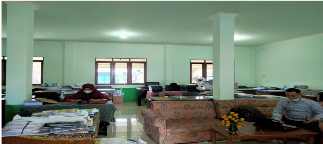
Ruang Kelas Siswa Pasca Banjir Besar Januari