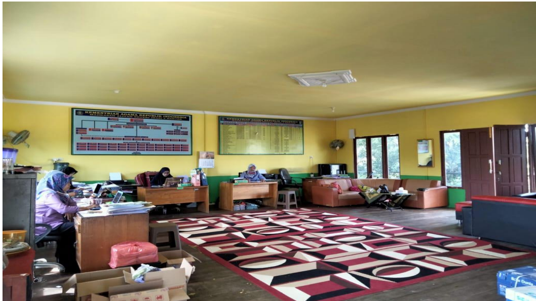
Kantor dan Guru-guru