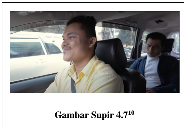
Gambar Supir 4.7 10