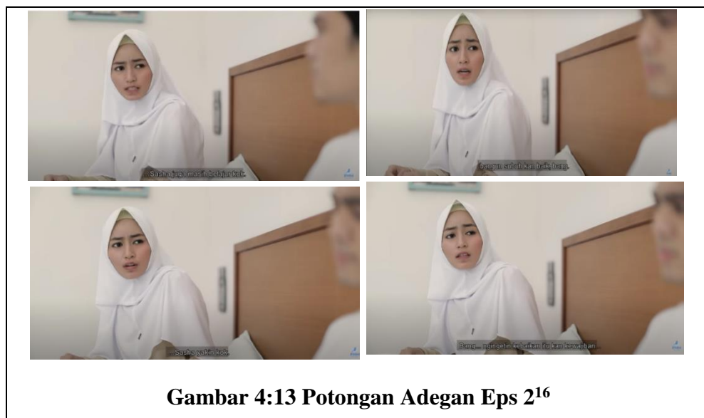
Gambar 4:13 Potongan Adegan Eps 2 16

Pada adegan ini Dani untuk pertama kalinya bertemu dengan keluarganya yang baru (setelah berhijrah) Dani bingung karena banyak sekali pe-