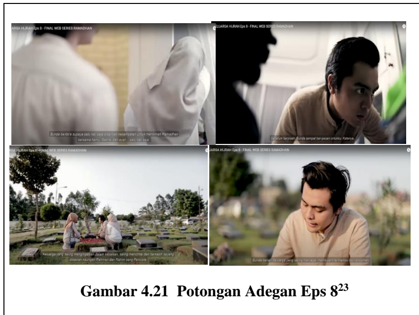
Gambar 4.21 Potongan Adegan Eps 8 23

Pada episode ini Dani untuk pertama kalinya Ramadhan bersama-sama keluarganya setelah proses hijrah itu, Kemudian saat 1 Syawal tiba, Bunda nya meninggal karena penyakit hepatitis yang diderita nya. Dani sangat kesal karena dia tidak diberitahu oleh keluarganya kalau ibunya sakit. Pada durasi 6:27-7:41 terdapat qawlan karima dan qawlan maissura yaitu ibunya berkata kata dengan mulia dan ringan yaitu mendoakan orang-orang yang ia sayang dilembutkan hatinya, dimulakan akhlaknya, istiqomah dan konsisten. Pada durasi 9:11-9:28 terdapat qawlan tsaqilah yaitu kata kata yang mengandung kebenaran tidak ada keraguan, Bunda berkata bahwa keluarga yang saling menjaga, membuat keluarganya mamapu beristiqomah. Pada durasi 9:31- 9:43 terdapat qawlan ma'rufa yaitu berkata-kata ringan dan sederhana seperti pada dialog, keluarga yang saling mengingatkan dalam kebaikan, saling mencintai dan berasih sayang dibawah naungan Rahman dan Rahim sang pencipta. Semenjak ibunya meninggal