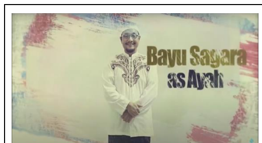
Gambar Ayah 4.5 8