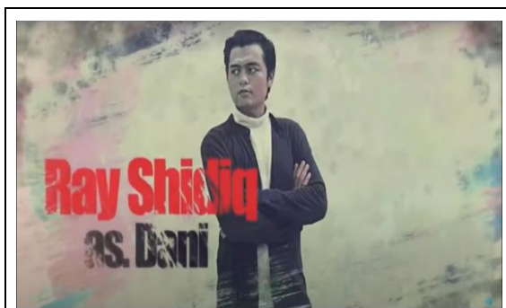
Gambar Dani 4.2 5