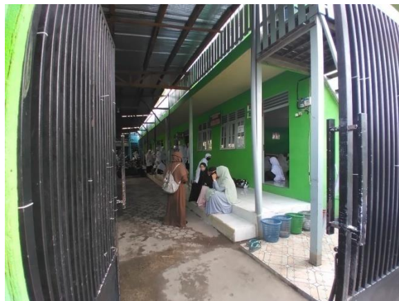
Foto Pondok Pesantren Nurul Jannah Banjarmasin