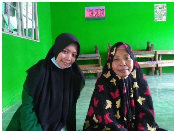
Foto saat wawancara dengan ustazah Pondok Pesantren Nurul Jannah